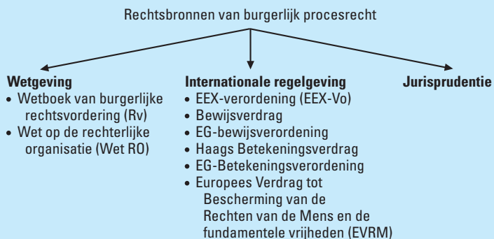
Figuur 1.1 Rechtsbronnen van burgerlijk procesrecht

In figuur 1.1 worden de rechtsbronnen van het burgerlijk procesrecht schematisch weergegeven. In de rest van deze paragraaf worden deze bronnen vervolgens kort toegelicht.