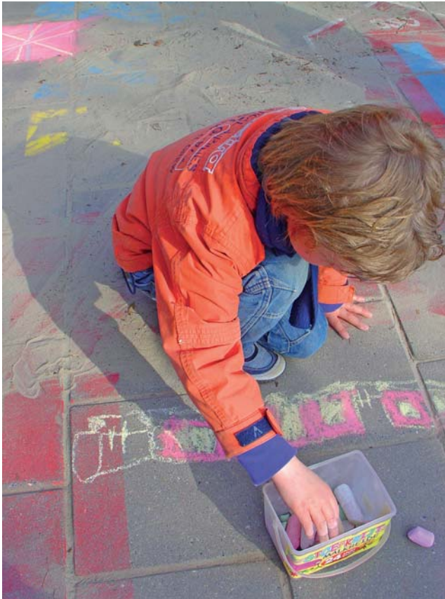
Treinen, dat is mijn hobby en daarom teken ik er een.