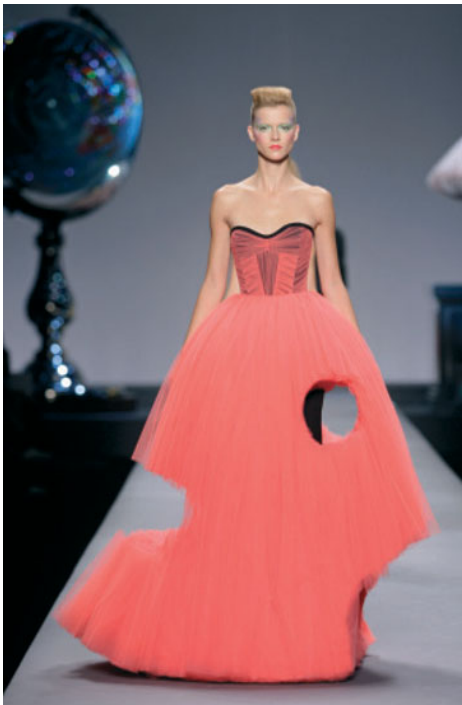
FIGUUR 1.5 Een creatie van Viktor & Rolf