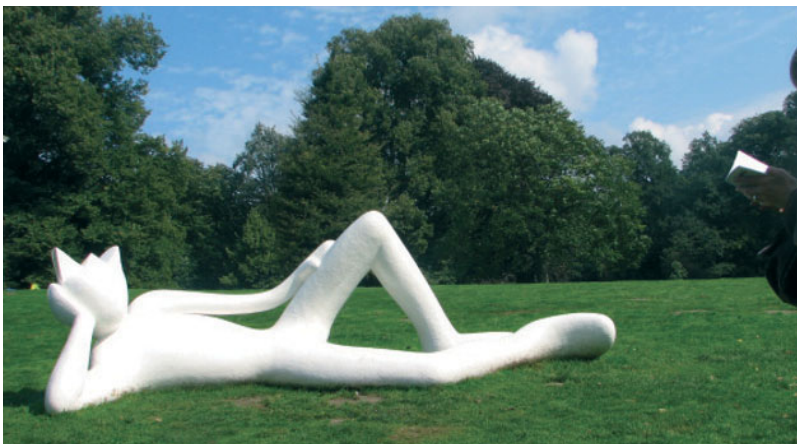
FIGUUR 1.9 Alain Séchas – Lazy King (2008), Park Sonsbeek in Arnhem

In paragraaf 1.3 heb je gelezen over de media, de dragers van cultuur. De kunstzinnige middelen (klank, beeld, drama, beweging en taal) zijn belangrijke media. De vier culturele basisvaardigheden (waarnemen, verbeelden, conceptualiseren, analyseren) zou je kunnen plaatsen onder het 'leren omgaan met kunst'. Kunsteducatie is in de definitie van cultuurnetwerk onderdeel van cultuureducatie, maar het is dus ook een onlosmakelijk onderdeel van het ruimere begrip cultuuronderwijs. Over het kunstwerk in figuur 1.9 hoef je kinderen niet veel te leren. Je moet erbij stilstaan wat je ervaart bij het zien van dit kunstwerk. De kunstenaar Alain Séchas gebruikt kunst als persoonlijk uitdrukkingsmiddel. Je ziet hoe de kunstenaar het begrip 'Lazy King' in beeldende taal weet uit te drukken, zodat je bijna voelt hoe lui deze figuur is zoals hij daar als koning uitkijkt over het grasveld, zijn domein. Ook kinderen ervaren direct dat gevoel van ontspanning als ze dit beeld zien.