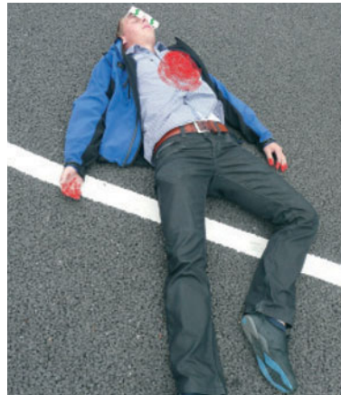
FIGUUR 1.7 Voorbeeld van een zelfportret met het lichaamsobject

Figuur 1.7 geeft een voorbeeld van het eindresultaat van een student die deze opdrachten heeft gemaakt.