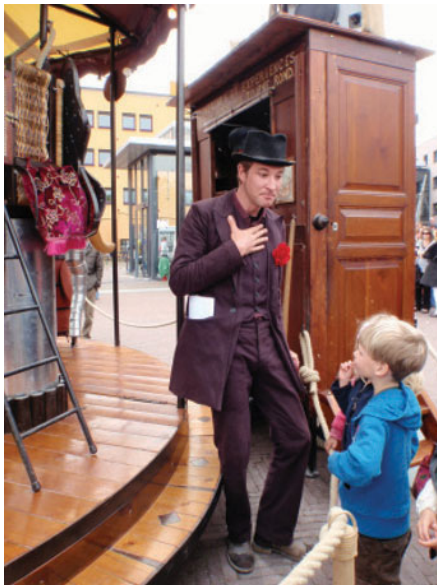
FIGUUR 1.1 Beleving van cultuur op straat

Welke uitspraak spreekt jou het meest aan?