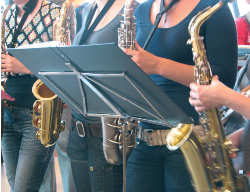
FIGUUR 1.2 Cultuur: muziek maken en daar plezier aan beleven

Hierna volgt een voorbeeld over het herinneringsmonument Koninginnedag 2009 dat dit continu proces van cultuur verduidelijkt.