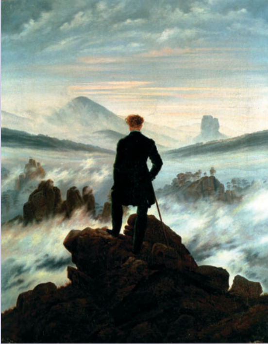
FIGUUR 1.13 Caspar David Friedrich – Der Wanderer über dem Nebelmeer