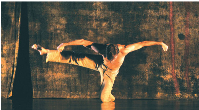
FIGUUR 1.4 De bewegingen van deze danser zijn een van de media waarin cultuur zichtbaar wordt

In de media is dus het uiterlijk van cultuur zichtbaar. De culturele basisvaardigheden gebruik je om cultuur te begrijpen in haar vorm en betekenis.