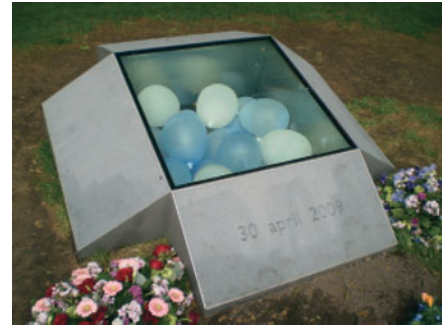
FIGUUR 1.3 Het Koninginnedag-monument in Apeldoorn