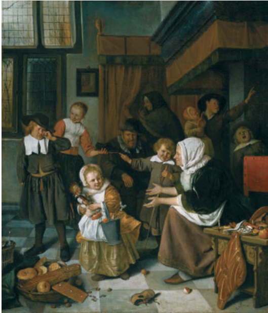
FIGUUR 1.11 Jan Steen – Het Sint-Nicolaasfeest, 1663-1665

schilderij uit de Gouden Eeuw. Het schilderij zelf is cultureel erfgoed, maar wat erop te zien is ook. Het Sinterklaasfeest is een typisch Nederlands feest dat al vele eeuwen gevierd wordt.