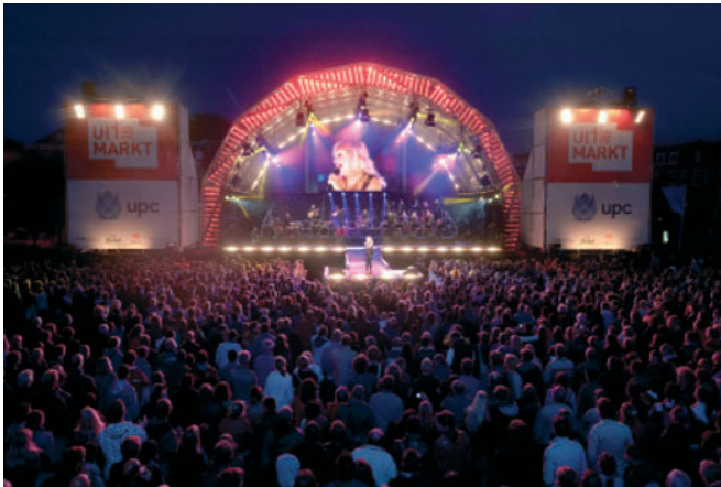
FIGUUR 1.8 De jaarlijkse Uitmarkt in Amsterdam

De jaarlijkse Uitmarkt in Amsterdam geeft de aftrap voor een nieuw seizoen vol cultuur in theater, concertzaal en museum (zie figuur 1.8).