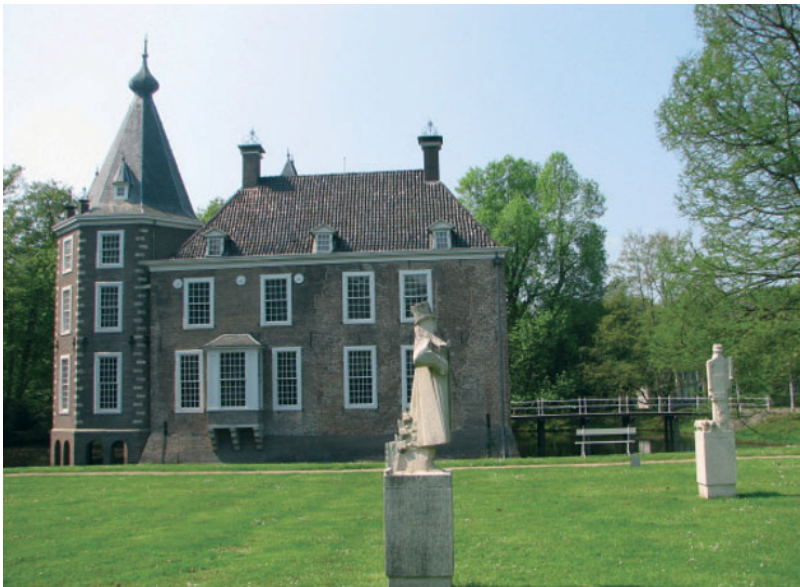
FIGUUR 1.10 Kasteel Het Nijenhuis in Heino

Ander erfgoed is immaterieel: verhalen, gebruiken, tradities, sommige feesten en de wijze waarop we ze vieren. Figuur 1.11 is een bekend