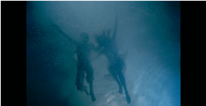
FIGUUR 1.12 Een beeld uit een van de videokunstwerken van Bill Viola

In het onderwijs is al veel digitaal lesmateriaal beschikbaar. Het accent in media-educatie ligt echter niet zozeer in het instrumentele gebruik van deze media maar meer bij het bewustmaken van de invloed die deze media hebben in de beeldvorming van kinderen van de werkelijkheid. In films kun je de werkelijkheid enorm manipuleren, in foto's wordt gefotoshopt, in videogames ontwerp je je eigen personages en de waarneming van filmbeelden wordt beïnvloed door de muziek die erbij gemonteerd wordt. Een van de onderwerpen bij media-educatie is de invloed die de media hebben op ons koopgedrag en de vorming van ons ideaalbeeld van de werkelijkheid. Dit zijn onderwerpen die in cultuuronderwijs dieper onderzocht worden.