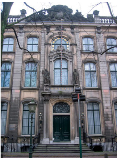
De Hoge Raad is gevestigd in Den Haag.