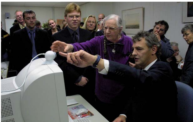
Minister Roger van Boxtel opent een van 'zijn' digitale trapveldjes.

Het stedenbeleid heeft zich in deze tweede GSB-periode ontwikkeld tot een brede programmatische aanpak. Afzonderlijke projecten werden niet meer gefinancierd. Er werden afspraken gemaakt met de steden over samenhangende programma's, de zogeheten meerjarenontwikkelingsprogramma's (MOP's). Een voorbeeld van zo'n MOP is het programma 'Opgroeien in de stad' van de gemeente Enschede. Dit MOP was gericht op een samenhangend beleidsprogramma voor de ontwikkeling van de Enschedese jeugd op het gebied van participatie, opvoedingsondersteuning, opvang en voor-schoolse voorzieningen.