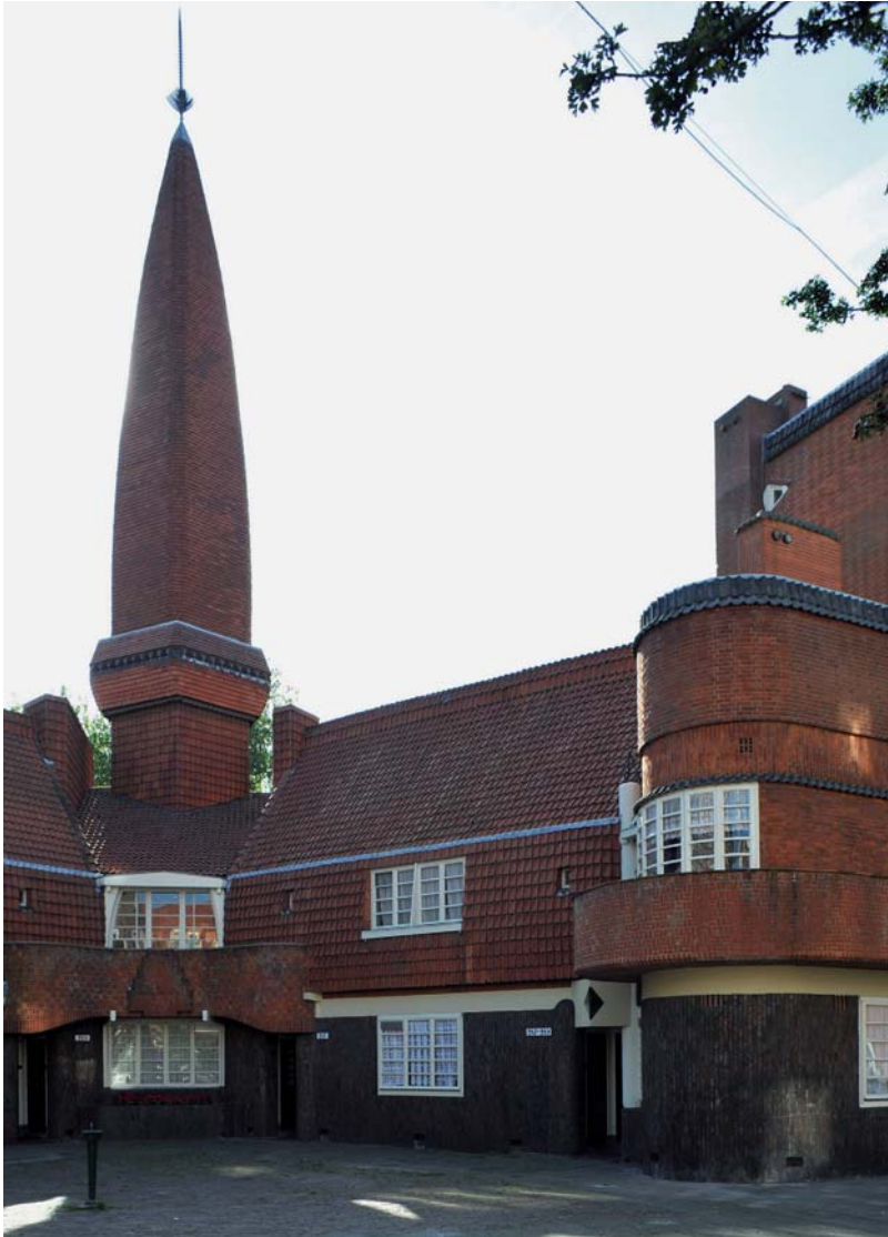
Met zorg ontworpen vooroorlogse arbeiderswoningen in de Amsterdamse Spaarndammerbuurt (Amsterdamse School)