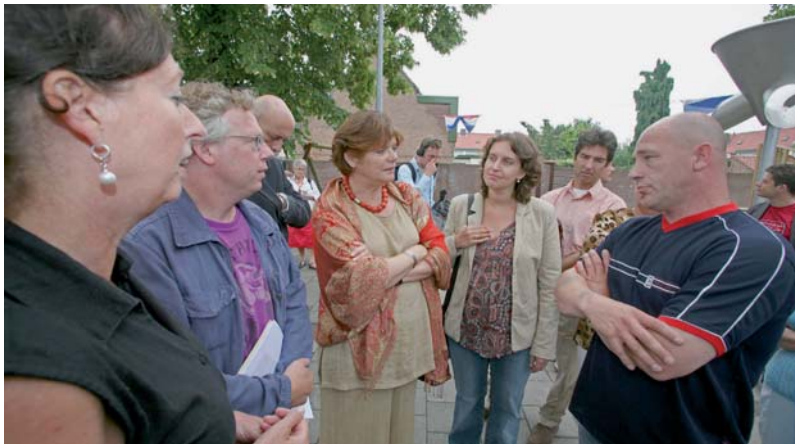
Minister Ella Vogelaar in de Utrechtse wijk Ondiep.

Bij de veertig-wijkenaanpak, die overigens geen deel uitmaakte van het GSB, ging het om de vijf thema's: wonen, werken, leren, integratie en veiligheid. In veertig wijkactieplannen, de zogeheten WAP's, gaven de steden zelf aan hoe zij die vijf thema's gingen uitwerken. Het was de bedoeling dat de veertig geselecteerde 'krachtwijken' in acht à tien jaar zouden zijn getransformeerd in 'prachtwijken'.