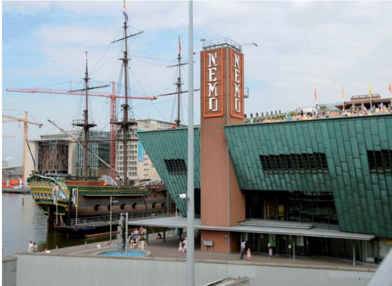
NEMO en VOC-schip 'De Amsterdam'

Op dit moment zijn de Nederlandse steden weer meer in trek als plek om te wonen en de vrije tijd door te brengen dan enkele decennia geleden. Grote evenementen, een aantrekkelijke inrichting van de openbare ruimte, moderne architectuur en luxe appartementencomplexen zorgen ervoor dat de steden weer positiever in de belangstelling staan. Een grootstedelijke uitstraling oefent aantrekkingskracht uit op mensen met verschillende achtergronden.