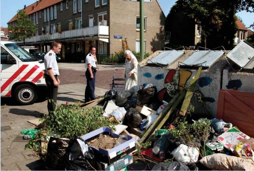
De Opzomerstraat in Rotterdam

In 1989 gaven de bewoners van de Opzomerstraat in Rotterdam hun straat een flinke opknappbeurt. Dit 'opzomereren' sloeg aan. Vijf jaar later, in 1994, werkten maar liefst 10000 Rotterdammers aan het 'opzomereren' van meer dan een kwart van alle Rotterdamse straten.