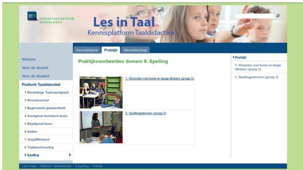
FIGUUR 1.3 De website Les in taal , waarop een koppeling wordt gemaakt tussen de kennisbasis en praktijkvoorbeelden