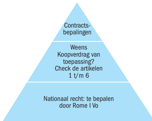
FIGUUR 1.1 Recht bij een internationale koop

Zijn er geen internationale regelingen die toegepast kunnen worden, dan dienen de conflictregels van het land van de rechter te bepalen welk rechtsstelsel van toepassing is op de rechtsrelatie. Deze nationale ipr-regels zijn objectieve verwijzingsregels, dus in het ene geval zullen de nationale conflictregels naar het eigen privaatrecht verwijzen, in het andere geval naar het recht van de wederpartij.