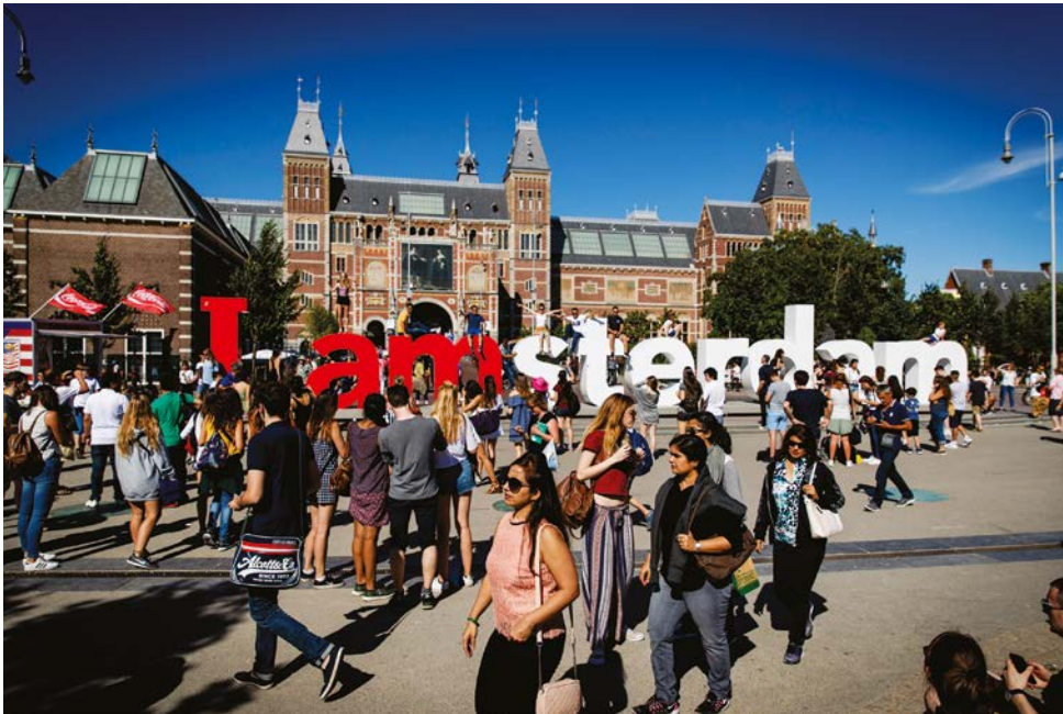
Het Museumplein in Amsterdam, nog mét de iconische letters

Op dit moment zijn de Nederlandse steden weer veel sterker in trek als plek om te wonen en om vrije tijd door te brengen dan enkele decennia geleden. Grote evenementen, een aantrekkelijke inrichting van de openbare ruimte, moderne architectuur en luxe appartementencomplexen hebben ervoor gezorgd dat de steden weer positiever in de belangstelling zijn komen te staan. Een grootstedelijke uitstraling oefent aantrekkingskracht uit op mensen met verschillende achtergronden.