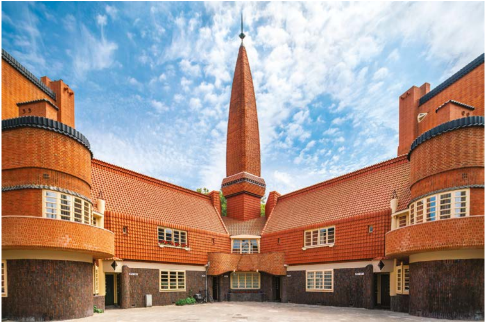
Sociale woningbouwcomplex met postkantoor in Amsterdam-West, ontworpen door architect Michel de Klerk (Amsterdamse School) in de jaren twintig van de vorige eeuw, nu een museum

Het PCG-beleid werd gevoerd tot 1989. Het kabinet-Lubbers III verving het daarna door het sociaal vernieuwingsbeleid. Het doel van het beleid van de sociale vernieuwing was net als dat van het PCG-beleid sociale achterstanden te bestrijden. Het beleid richtte zich op de emancipatie van de stadsbewoners door werkgelegenheids- en scholingsprojecten en op het versterken van de sociale cohesie in kwetsbare stadsbuurten.