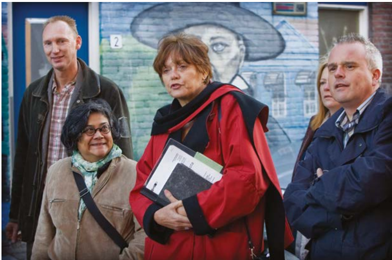
Toenmalig minister Ella Vogelaar op bezoek in de Haagse Schilderswijk

Bij de veertigwijkenaanpak, die overigens geen deel uitmaakte van het GSB, ging het om de vijf thema's wonen, werken, leren, integratie en veiligheid. In veertig wijkactieplannen, de zogeheten WAP's, gaven de steden zelf aan hoe zij die vijf thema's gingen uitwerken. Het was de bedoeling dat de veertig geselecteerde 'krachtwijken' in acht à tien jaar zouden zijn getransformeerd in 'prachtwijken'.