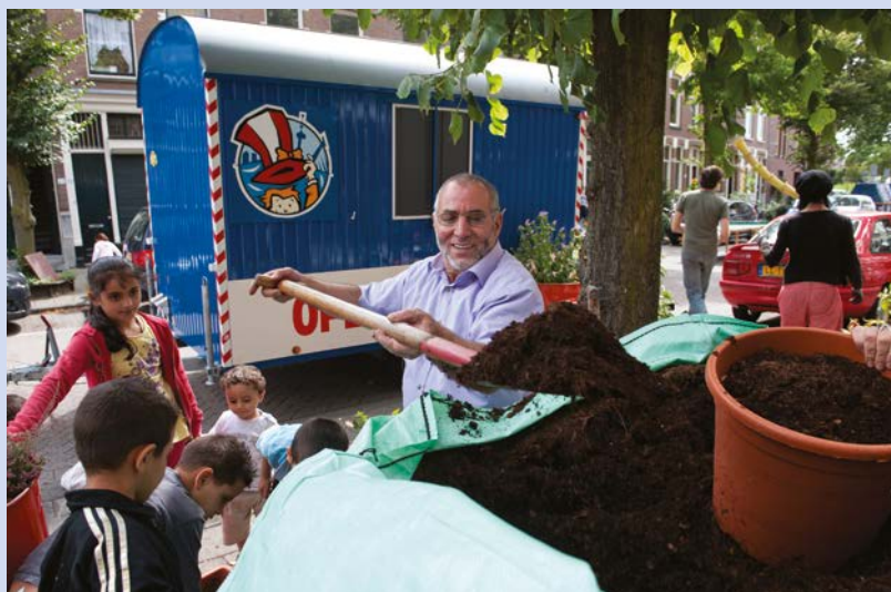
Opzoomeren in Rotterdam

In 1989 gaven de bewoners van de Opzoomerstraat in Rotterdam hun straat een flinke opknapbeurt. Dit 'opzoomeren' sloeg aan. Vijf jaar later, in 1994, werkten maar liefst 10.000 Rotterdammers aan het opzoomeren van meer dan een kwart van alle Rotterdamse straten.