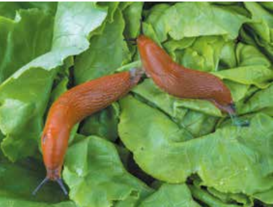
Als het regent komen de slakken tevoorschijn.

DIEREN VOELEN ZICH VAAK ERG THUIS IN DE TUIN, VOORAL ALS DIE EEN BEETJE ROMMELIG IS. DAAR IS GENOEG TE ETEN EN JE KUNT ER FIJN WONEN.