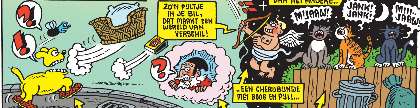
ZO'N PULTJE IN JE BIL, DAT MAAKT EEN WERELD VAN VERSCHIL!