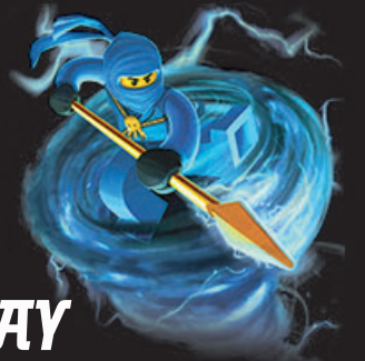
JAY NINJA VAN DE BLIKSEM