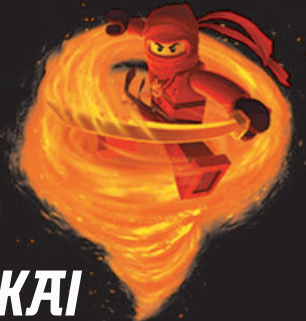
KAI NINJA VAN HET VUUR

De ninja's veranderen van vorm wanneer ze hun elementen, zoals vuur of ijs, gebruiken. Verbind elke ninja met de juiste vorm. Kijk goed naar de symbolen: het symbool dat het meeste voorkomt toont wat hun element is.