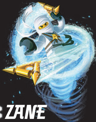
ZANE NINJA VAN HET IJS