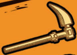
ZEIS VAN SCHOKKEN

Help de ninja's door het doolhof en geef elk Gouden Wapen een cijfer in de volgorde waarin je ze tegenkomt.