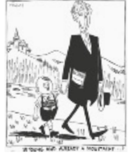
V.l.n.r. foto (bron 12, Oriëntatietoets), affiche (bron 5, HC China) en spotprent (bron 9, HC Duitsland in Europa).