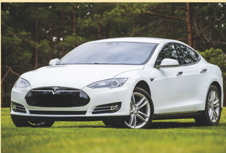
Figuur 8 Tesla model S