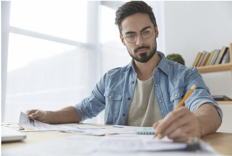
Figuur 18 Ga je werken als zzp'er, dan is het belangrijk een goed uurtarief te berekenen.

voor nieuwe opdrachten. Is hij klaar met een klus, dan is er niet vanzelf een volgende klus om aan te beginnen.