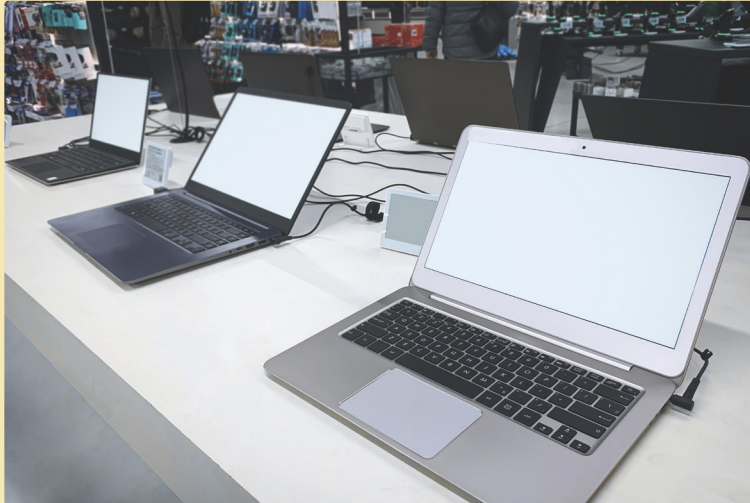
Figuur 6 Alle computerwinkels samen noem je een bedrijfstak. De computerbranche is groter dan alleen deze bedrijfstak.

Alle winkels die computers verkopen, vormen samen een bedrijfstak. Deze bedrijven leveren de computers direct aan consumenten. De computerbranche is groter dan alleen deze bedrijfstak. Tot de branche horen bijvoorbeeld ook bedrijven die computers produceren en de groothandels die de computers aan de winkels leveren.