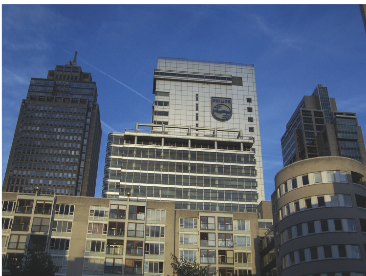
Figuur 15 Hoofdkantoor van Philips Lighting nv

De naamloze vennootschap is 'naamloos' omdat er bij de nv geen verplichting bestaat tot het houden van een register van aandeelhouders. De vennoten zijn dus anoniem. De nv is de meest geschikte vennootschap voor grootschalig aandeelhouderschap van vennoten die elkaar niet hoeven te kennen. Beperkte aansprakelijkheid en rechtspersoonlijkheid zijn logischerwijs verbonden met deze anonimiteit.