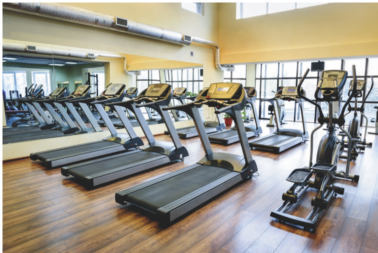
Figuur 2 Ook in je vrije tijd heb je te maken met organisaties.

De meeste bedrijven hebben bestaansrecht omdat ze winst willen maken en moeten maken om te blijven bestaan. Dit noem je het economische doel van een bedrijf. Daarnaast vervullen bedrijven maatschappelijke behoeftes: het maken van producten of het vervullen van diensten.