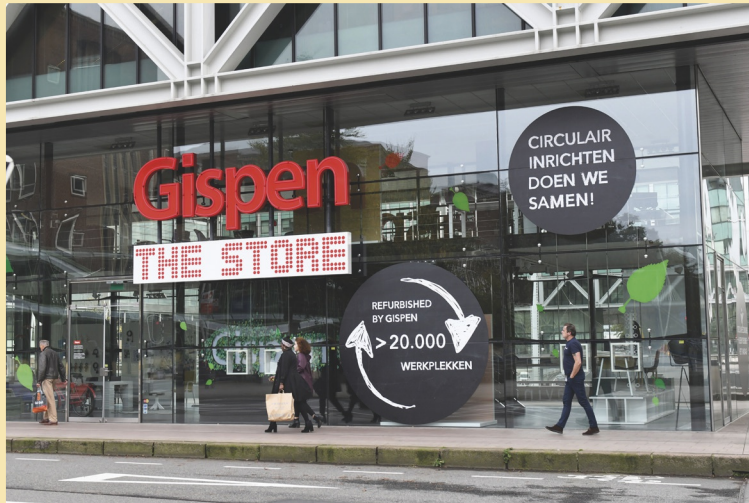
Figuur 20 Ook de Nederlandse meubelmakers van Gispen hebben duurzaamheid hoog in het vaandel.

Door het opnieuw verhuren maken ze winst. De aarde en het milieu worden minder belast omdat er minder kantoormeubelen weggegooid worden door ze te recyclen.