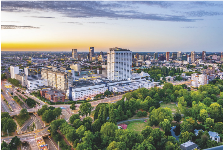
Figuur 3 Het Erasmus MC in Rotterdam is een van de grootste werkgevers van de stad. Het is een voorbeeld van een dienstverlenend bedrijf.

Dienstverlenende bedrijven leveren diensten. Voorbeelden van dienstverlenende bedrijven zijn banken, verzekeringsmaatschappijen, administratiekantoren, ziekenhuizen en zorginstellingen.