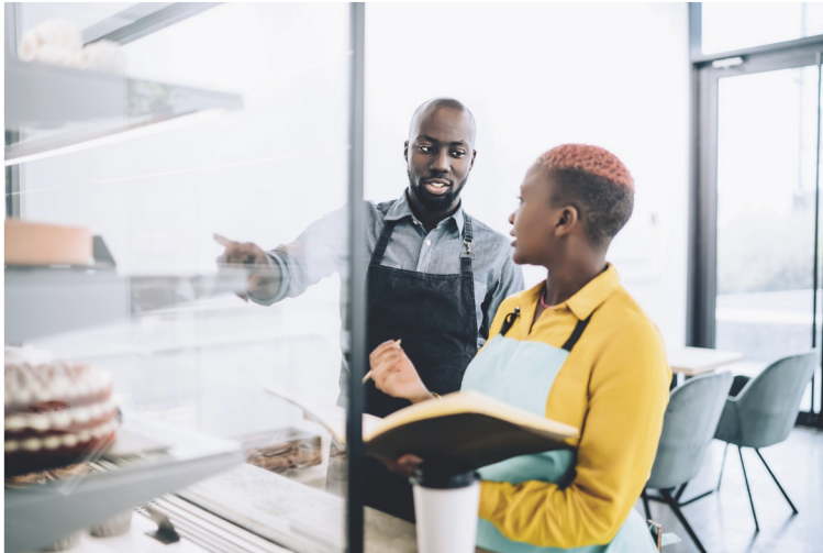
Figuur 10 Een eenmanszaak heeft één eigenaar. Er kunnen wel meerdere mensen werken.