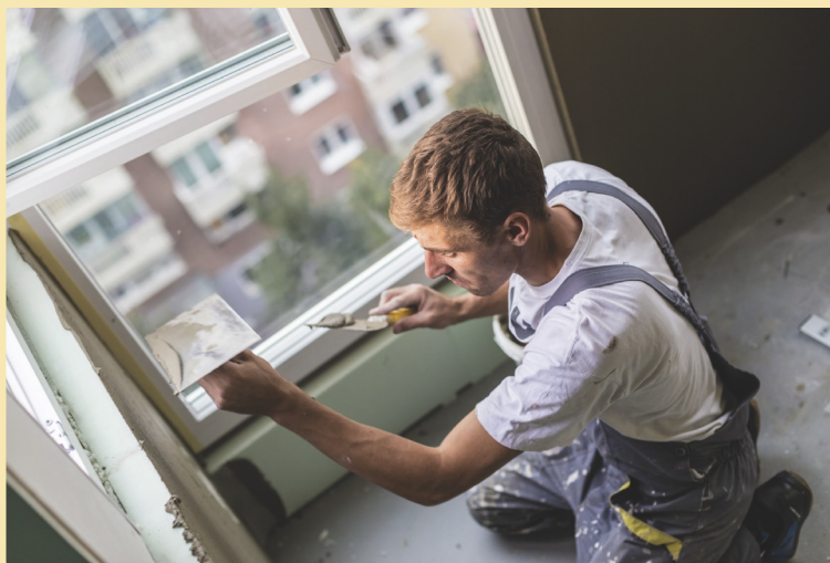
Figuur 17 Als je jezelf laat inhuren als zzp'er kun je per uur vaak meer verdienen dan in loondienst.

Janus had er ook voor kunnen kiezen om een eenmanszaak op te richten. Dan moet hij zich wel inschrijven bij de Kamer van Koophandel. Bij de dagelijkse werkzaamheden en inkomsten zal hij verder geen verschil merken.