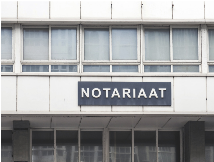
Figuur 14 Een bv wordt opgericht bij de notaris, samen met de aandeelhouders.

De bestuurders van de bv zijn verplicht ervoor te zorgen dat de bv wordt ingeschreven in het handelsregister bij de Kamer van Koophandel. De dagelijkse leiding van de bv berust bij het bestuur. Dit bestuur wordt in het dagelijks leven de directie genoemd. De bestuurders van de onderneming zijn niet aansprakelijk voor de schulden van de bv. Bij een faillissement kunnen de bestuurders alleen hoofdelijk aansprakelijk worden gesteld als onbehoorlijk bestuur de oorzaak is van een faillissement.