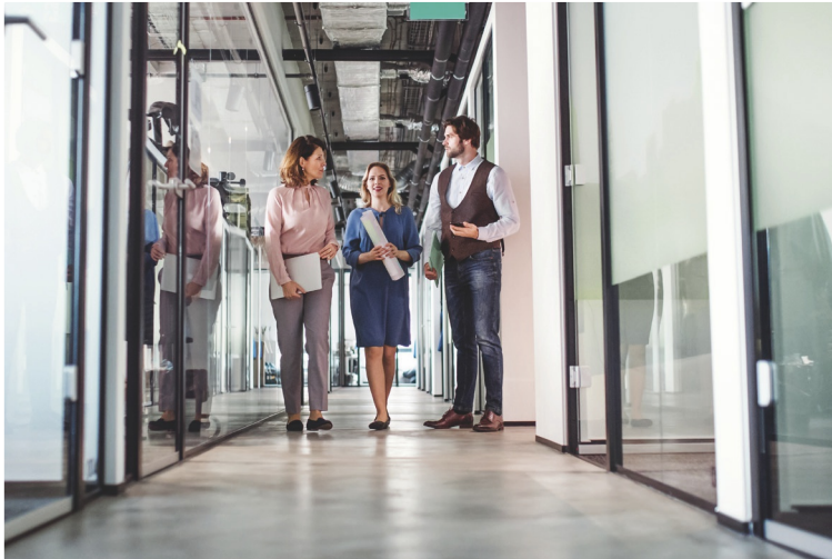
Figuur 13 Stille vennoten werken niet in het bedrijf. Ze kunnen wel advies geven.