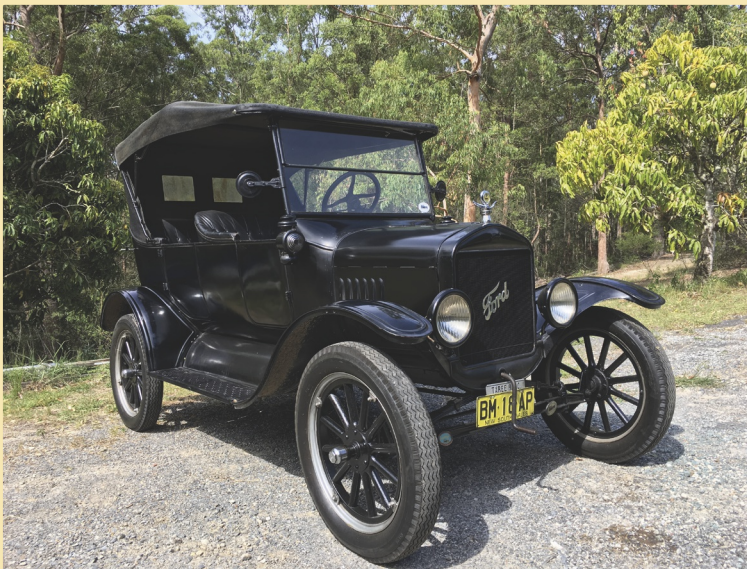
Figuur 7 Ford Model T Touring 1925