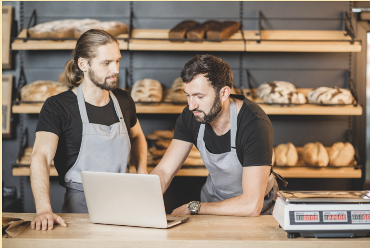
Figuur 12 Verschillende eigenaren werken samen in een vof. Ze zijn samen verantwoordelijk voor de winst en de schulden van het bedrijf.

Vader en zoon gaan samen naar de Kamer van Koophandel en veranderen daar de ondernemingsvorm. Voortaan is het bedrijf een vof.