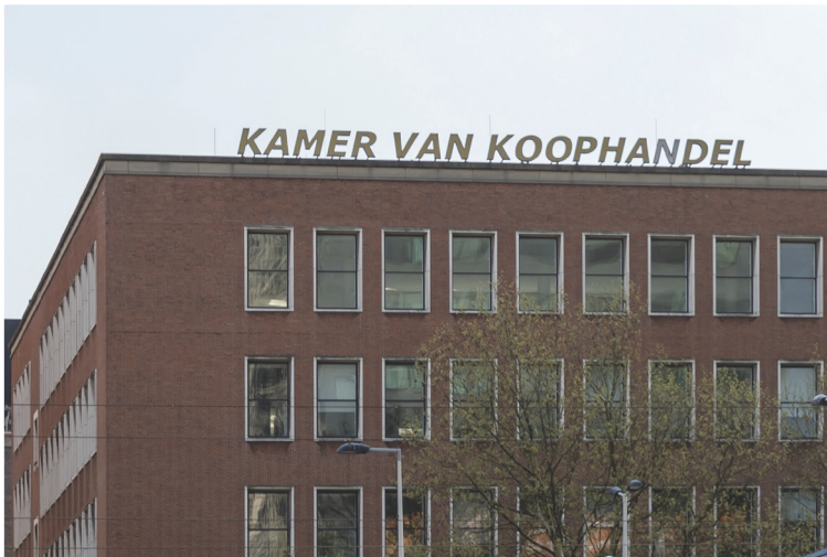
Figuur 9 Bedrijven staan ingeschreven in het handelsregister van de Kamer van Koophandel.

Als ondernemingsvorm is de eenmanszaak de eenvoudigste vorm om te starten. Het enige wat je hoeft te doen, is langsgaan bij de Kamer van Koophandel (KvK) en de nieuwe onderneming inschrijven in het handelsregister.