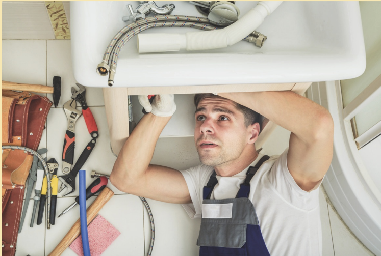
Figuur 16 Alex is bang dat hij als eigenaar van een zelf minder op de werkvloer kan staan.

Alex denkt nog een paar dagen na. Dan vertelt hij Ruud dat hij een besluit heeft genomen: hij gaat het bedrijf niet overnemen. Maar als Ruud het bedrijf verkoopt, mag de nieuwe eigenaar hem altijd inhuren. Alex gaat een eenmanszaak beginnen – hij blijft liever veel op de werkvloer.