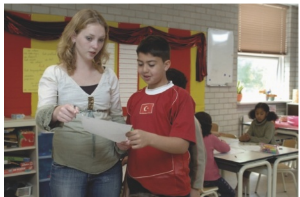
Figuur 1.2 De onderwijsassistent begeleidt leerlingen

opvang, maar daarnaast ook in onderwijsvoorzieningen waar voor- en vroegschoolse educatie wordt aangeboden. En in organisaties die opvoedingsondersteuning en/of ondersteuning aanbieden. Het gaat vaak om kinderen of jongeren met een ontwikkelingsachterstand. Je biedt de kinderen, veelal in groepsverband, een stimulerende omgeving voor hun ontwikkeling. Je kunt een sturende en begeleidende rol vervullen voor collega's en vrijwilligers. Soms ben je het aanspreekpunt voor de ouders/opvoeders. Als onderwijsassistent werk je in het basisonderwijs, voortgezet onderwijs, middelbaar beroepsonderwijs, speciaal onderwijs of in de volwasseneneducatie. Je werkt met leerlingen/studenten in de leeftijd van 4 tot 16 jaar. Je ondersteunt de leerkracht bij het geven van onderwijs. Je houdt je bezig met de vraag hoe leerlingen maximaal kunnen profiteren van het onderwijs. Je bereidt de leeromgeving voor, begeleidt leerlingen individueel of in groepjes en neemt taken van de leerkracht over. Een onderwijsassistent werkt altijd onder verantwoordelijkheid van de leerkracht.