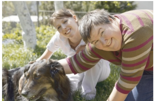
Figuur 1.3 Je werkt met kwetsbare doelgroepen

diploma: 'De problemen die ik tegenkom, zijn soms gigantisch. Sommige mensen hebben in hun jonge leven zo veel meegemaakt en zo veel tegenslag gehad, dat wil je niet geloven. Die hebben het helemaal gehad, hebben alle vertrouwen verloren en willen niks. Het is niet gemakkelijk om ze te motiveren en op het juiste spoor te zetten. Maar als het dan lukt, geeft dat heel veel voldoening.'