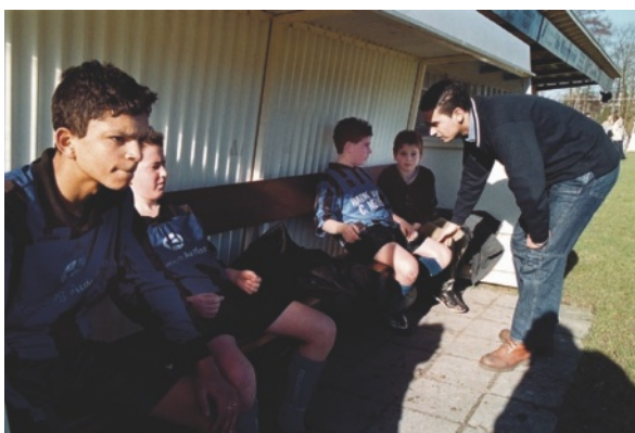
Figuur 1.1 Mensen maken deel uit van de samenleving

Het werkterrein van de sociaal-agogisch werker ligt hier op het gebied van recreatie, kunst, cultuur, educatie, participatie en samenlevingsopbouw.