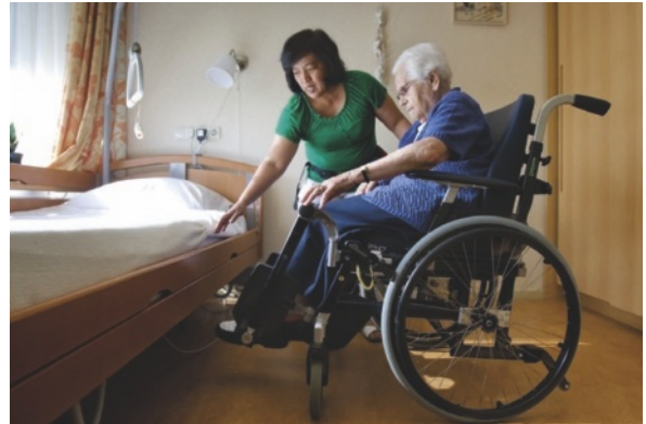
Figuur 1.6 Hier is genoeg manoeuvreerruimte

Toegankelijkheid voor iedereen wordt ook wel integrale toegankelijkheid genoemd. Dat wil zeggen dat er geen speciale voorzieningen voor mensen met een beperking zijn, maar dat de gewone gebruiksruimten voldoende bruikbaar zijn voor iedereen.