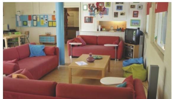
Figuur 1.8 Geen stoffen meubels voor kinderen met astma