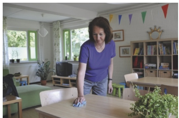
Figuur 1.4 Iets gemorst? Dan maak je meteen schoon

Het onderhoud van de leefomgeving betekent dat deze opgeruimd en schoon is en er verzorgd uitziet. Van je eigen kamer of huis weet je hoe snel het een rommeltje kan worden. Regelmatig opruimen en schoonmaken is noodzakelijk om er voor te zorgen dat de ruimte leefbaar blijft. Als je met meer mensen een ruimte gebruikt, is het nog belangrijker dat alles na gebruik meteen weer wordt opgeruimd. Want spulletjes van jezelf vind je leuk, die van een ander vind je al gauw troep die in de weg ligt.