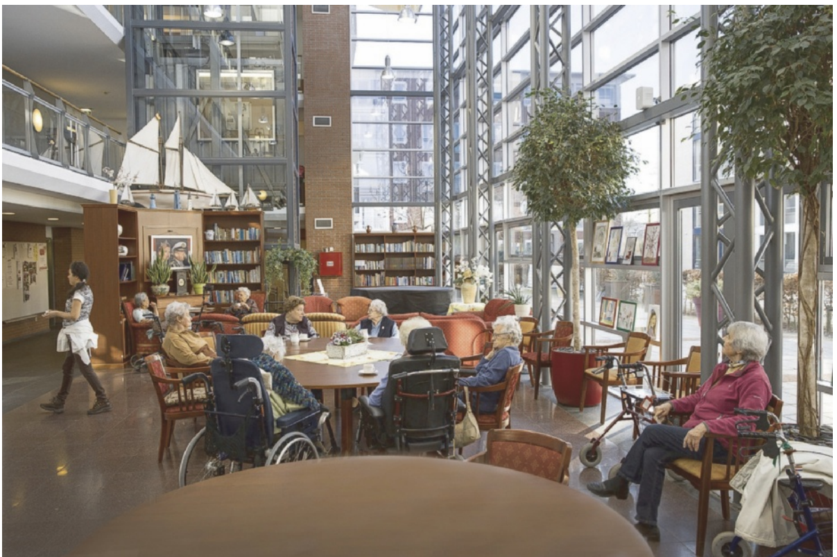
Figuur 1.2 Prikfels zorgen voor een stimulerende omgeving

De omgeving waarin je je bevindt, beïnvloedt je gezondheid. De omgeving binnen een gebouw kan ongezond zijn, zoals in een kamer waar veel gerookt wordt. Als een ruimte niet goed gestofzuigd is, krijgen mensen met COPD daar last van. Maar ook buiten het gebouw kan de lucht ongezond zijn. Zo kan een drukke verkeersweg zorgen voor veel fijnstof.