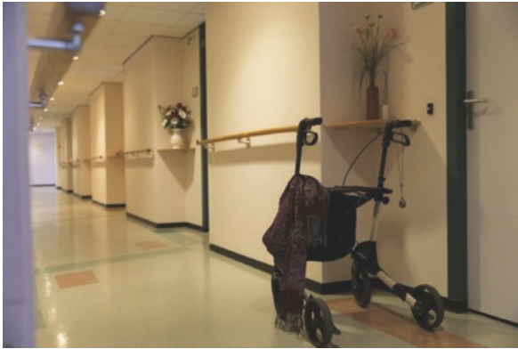
Figuur 1.1 De vloer is goed schoon te maken