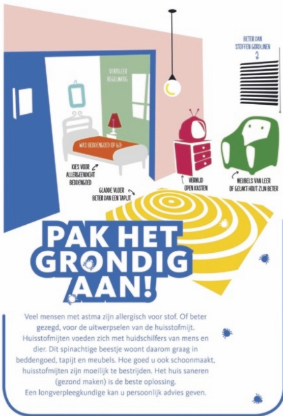
Figuur 1.7 Tips van het Longfonds tegen huisstofmijt

astma of zijn allergisch, zo heeft één op de tien Nederlanders luchtwegklachten. Bij de inrichting van de ruimte let je er daarom op dat die goed is schoon te houden en dat er geen stapels spullen liggen waar zich stof verzamelt. Bij het schoonmaken zorg je dat er zo min mogelijk stof opdwarrelt. Huisdieren zijn geen goed idee, alleen