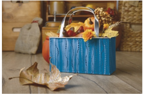
Figuur 1.3 Leuk als je ook binnen ziet welk seizoen het is

Een goede leefomgeving is sfeervol. De sfeer die een ruimte uitstraalt, heeft veel invloed op of je je er thuis voelt of niet. In een kale, donkere ruimte zul je niet graag lang willen blijven. Ook al is er alles aanwezig wat je nodig hebt om je werk te doen. De lichtinval, de verlichting, het kleurgebruik, de keuze van materiaal, de stoffering zijn samen bepalend voor de sfeer. Met accessoires zoals planten, schilderijen of ingelijste foto's kun je de sfeer ook beïnvloeden. Wat de juiste sfeer is, hangt af van het doel en de doelgroep. Een ruimte kan een gezellige en warme sfeer uitstralen, een rustgevende sfeer of een sfeer die uitlokt tot activiteit.