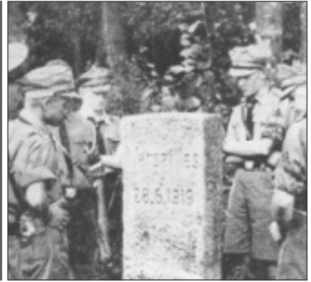
V.l.n.r. spotprent (opdracht 8, HC Nederland), affiche (opdracht 6, HC Britse Rijk) en foto (opdracht 5, HC Duitsland in Europa).