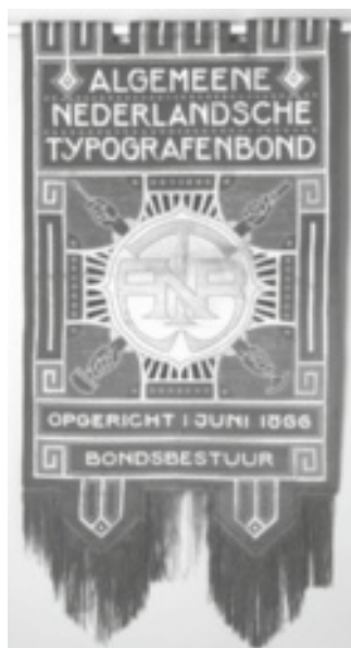
Afbeelding van het vaandel van de oudste vakbond van Nederland. In een vakbond werken alle plaatselijke vakverenigingen samen op landelijk niveau om sterker te staan tegenover de werkgevers.