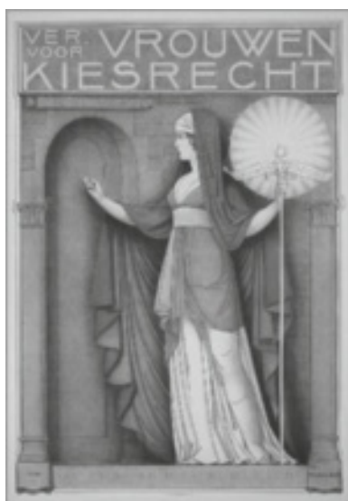
Propagandaposter voor vrouwenkiesrecht.

5 Eerste Feministische Golf: ook in Nederland streden vrouwen (en enkele mannen) voor gelijke rechten voor man en vrouw. Vrouwen organiseerden zich in verenigingen die streden voor kiesrecht voor vrouwen en voor toegang tot het hoger onderwijs. De bekendste feministe, Aletta Jacobs, heeft zich haar hele leven ingezet voor de politieke en sociale emancipatie van de vrouw. Aletta Jacobs was: – de eerste vrouw die toestemming kreeg om te gaan studeren aan de universiteit; – de eerste vrouwelijke arts; zij zette zich vooral in voor geboortebeperving voor arbeidersvrouwen; – een van de oprichters van de Vereniging voor Vrouwenkiesrecht.