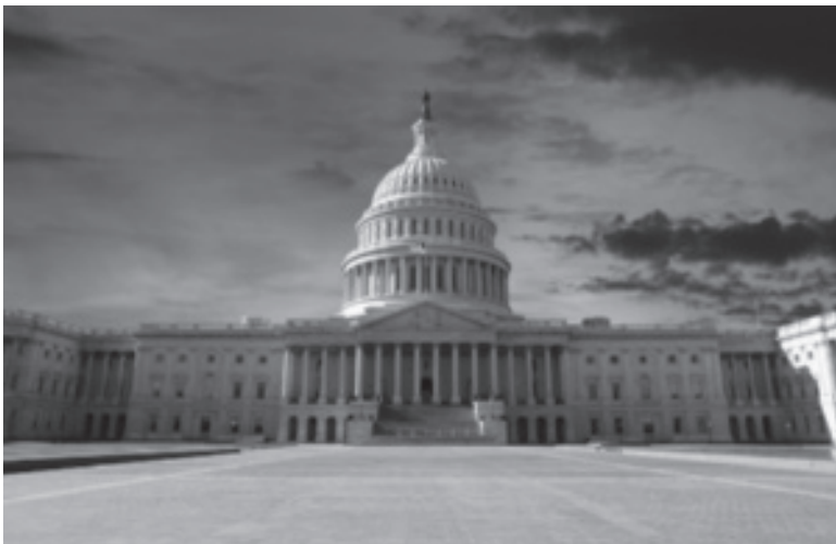
Capitool in Washington (Verenigde Staten). Inspiratie voor de naam was het Capitoolijn, één van de zeven heuvels waarop Rome is gebouwd als verwijzing naar het klassieke Rome. De wijk waarin het Capitool ligt, is vernoemd naar de oorspronkelijke heuvel: Capitol Hill.