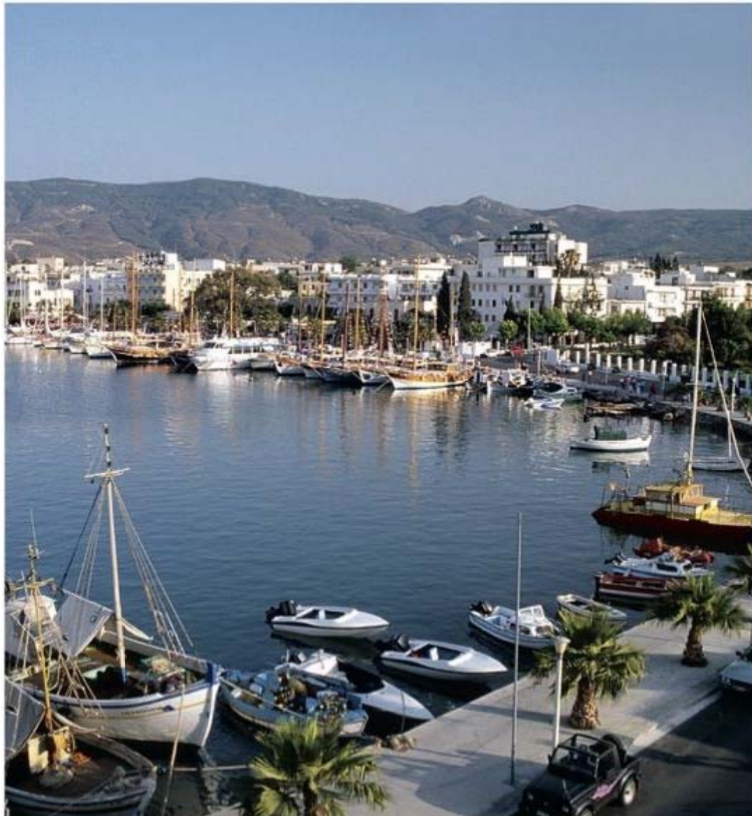
In de haven van Kos-stad liggen altijd veel excursieboten

specialiteiten op het dagmenu. Een geliefd gerecht is pligoúri , een puree van grof gemalen tarwe, kikkererwten en olijfolie – en in juli ook anthoús , ofwel met rijst en kruiden gevulde courgettebloemen.