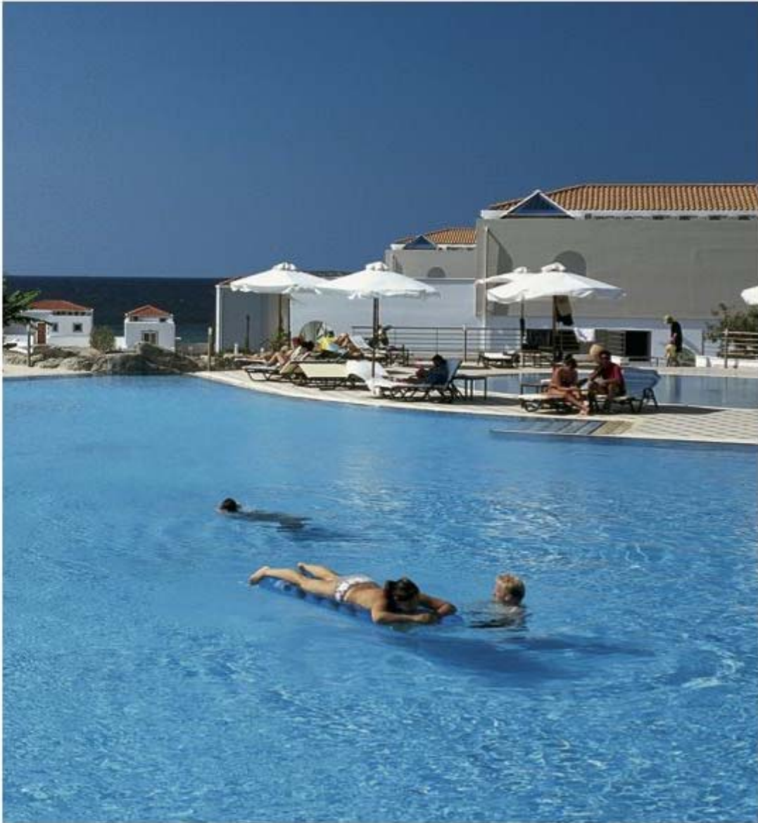
Heerlijk ontspannen in een hotel in Mastichári

bedden of een tweepersoonsbed staan. Vrijstaande vakantiehuisjes worden op Kos niet verhuurd. Alle appartementen worden verhuurd inclusief beddengoed en handdoeken, en ook wordt er geen extra bedrag in rekening gebracht voor de eindschoonmaak. Op de websites van Neckermann ( www.neckermann.nl ) en Sunweb ( zon.sunweb.nl ) vindt u diverse appartementen en hotels op Kos.