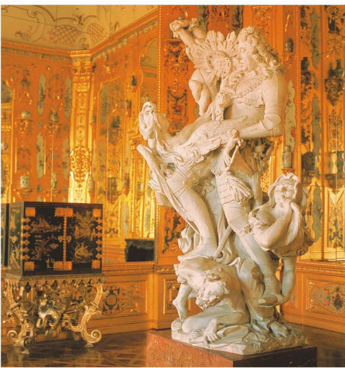
Monument voor een oorlogsheld in Schloss Belvedere in Wenen. Zie blz. 96.