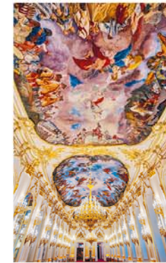
Onder dit uitbundig beschilderde plafond woonde keizerin Maria Theresia.

Na zoveel elegantie en luxe is het goed om aan de tuinkant even naar buiten te gaan om een frisse neus te halen. Dan blijkt ook het barokke Schlosspark 2 een waar schouwspel te zijn. Beklim voor een eerste indruk de trap naar het bordes. Hiervandaan zie je goed de strakke symmetrie van de Große Parterre, rechts en links van de verlengde middenas van het slot. Aan de rand van deze baroktuin bevindt zich de Neptunbrunnen, de fontein die deel uitmaakte van het tuinontwerp uit de tijd van Maria Theresia.