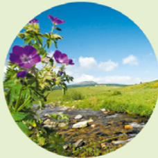
De Loire, de langste rivier van Frankrijk, begint als een rustig kabbelend beekje.

Aan de voet van de weg ligt de Source de la Loire 2, maar ik moet er wel bij zeggen dat ook andere bronnen in de race zijn voor die titel. Als officiële bron geldt hier een beekje dat in een ste-