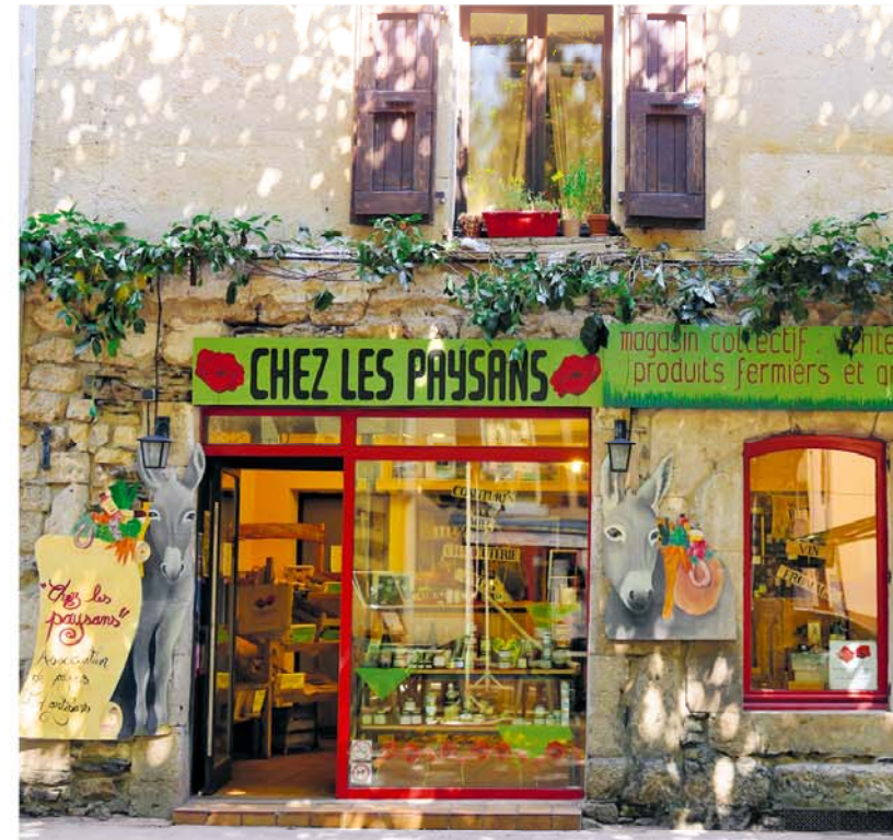
Het boerenbedrijf is hier alleen nog lonend wanneer de boeren hun producten rechtstreeks aan de man brengen. In deze winkel in Florac doen ze dat gezamenlijk in plaats van ieder voor zich.

Office de Tourisme: Place du Forail, 48000 Mende, tel. 04 66 94 00 23, www.ot-mende.fr.