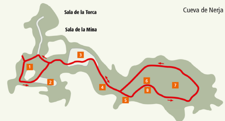
Uitneembare kaart: J 5

Slechts een klein deel van de grot is voor het publiek toegankelijk; de Galerías Altas en de Galerías Nuevas met nog meer grote ruimtes zijn alleen geopend voor onderzoekers en excursies met gids.