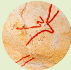
Een kijkje in het prehistorische prentenboek van de geschiedenis van de mens.

Vervoer: de grot ligt ongeveer 4 km van Nerja en is bereikbaar via een afslag van de snelweg A-7. Vanaf Maro loopt een 1 km lang fiets- en voetpad. Busverbinding vanuit Nerja en Málaga met Alsa (► blz. 112) vanaf 8.30 uur ongeveer elk uur.