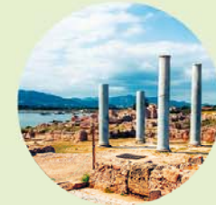
Het huis met het vierzijdige atrium was een van de voornaamste woonhuizen in Nora.

Op de landtong, afgescheiden van het centrum van Nora, staat de grote Asclepiustempel 8,