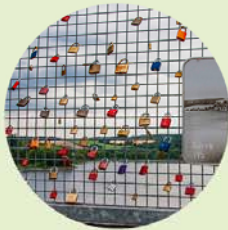
Blik op de Möhnesee.

De hoofdroute volgt na Niederense de B7. Sluit aan op de Ruhr en volg deze tot het station Neheim-Hüsten.