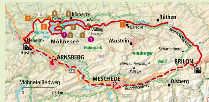
Uitneembare kaart: D 2 / E 2

Dichter aan het water kun je niet zitten, sommige kamers bieden direct zicht op