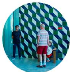
Een rondleiding door het Casa da Música brengt je ook in de betogelde Sala Renasença.