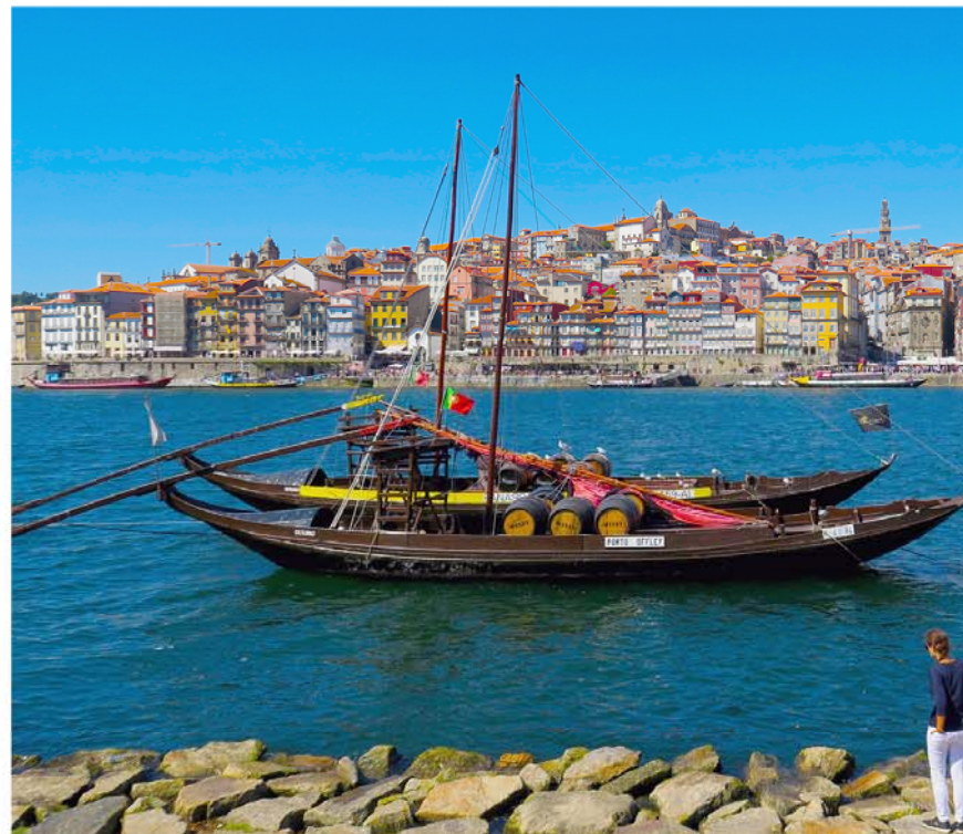
Rabelos voor de kade van Vila Nova de Gaia.