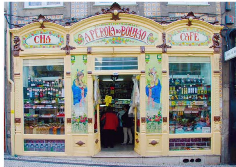
Een van de prachtige ouderwetse kruideniers.

Rua Galeria de Paris 20, tel. 222 022 105, www.avidaportuguesa.com, tram: 22, ma.-za. 10-20, zo. 11-19 uur