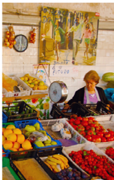
Groente- en fruitkraam op de Mercado do Bolhão.