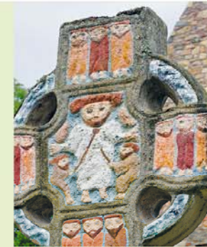
Een bontbeschilderd kruis – beslist historisch correct.

In zijn geheel vormt het park het misschien leerzaamste en ook aanschouwelijkste uitstapje in de Ierse geschiedenis dat je kunt beleven. Vooral buiten het hoogseizoen, als er weinig bezoekers zijn (en stevig schoeisel verplicht), is het met zijn uitgestrekte natuurgebied zeer ontspannend en ondanks alle informatie niet vermoeiend. Je kunt je fantasie hier de vrije loop laten en je op een wandeling op de wallen van het ringfort inleven in de mystieke druïde. Dat moet je dan Tuan niet vertellen. Je achterste zal je er dankbaar voor zijn.