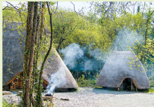
Vroege Ierse woningen – het prehistorische deel van het INHP.