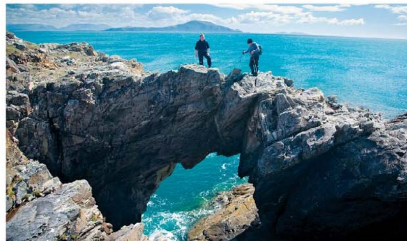
Wind en golven als architecten.

Achill Island, met 145 km² het grootste eiland van Ierland, is dankzij een korte brug moeiteloos te bereiken en biedt verlaten