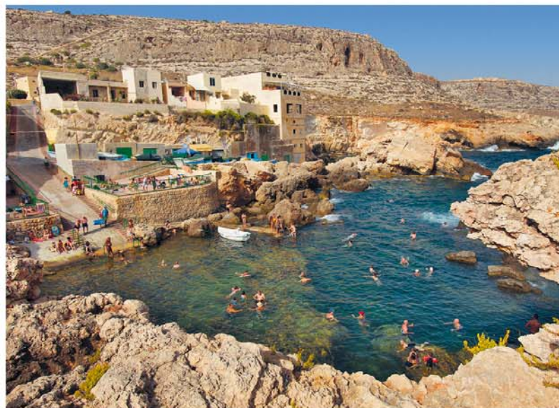
Naakte rotsen zover het oog reikt ... en daartussenin een natuurlijke poel: Ghar Lapsi is nog steeds een vissershaventje, maar ook een insidertip van de Maltezers voor een heerlijk dagje aan zee met de hele familie.

Vanuit Siggiewi (spreek uit sidsjiewi ) met het Limestone Heritage Park (► blz. 64) bereik je via een steengroeve en een zeewaterontziltingsinstallatie Ghar Lapsi (3,5 km, spreek