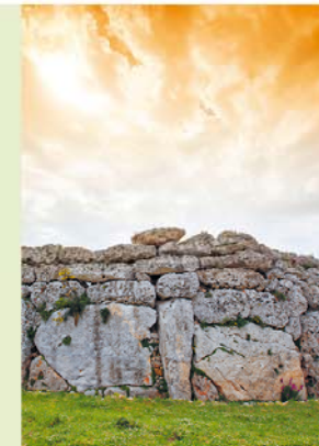
Gigantische stenen, mystiek licht – de verering van de Magna Mater, de moedergodin, is verleden tijd, maar haar tempels zijn gebleven.

Even iets anders dan stenen: tegenover de tempels kun je de oudste bewaard gebleven windmolen van Malta (1725) bezichtigen. De moeite waard!