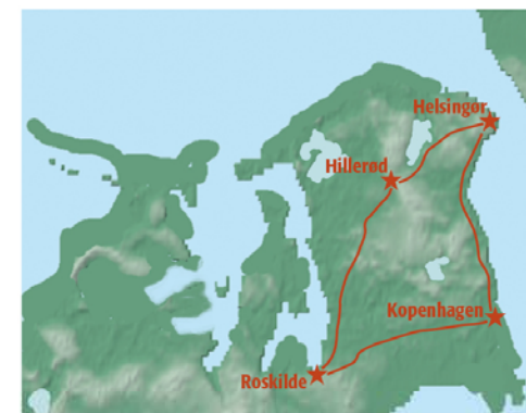
Rondreis langs de hoogtepunten

derweg passeert u onder meer Hillerød met het imposante kasteel Frederiksborg. In Roskilde zijn de kathedraal, opgenomen op de Werelderfgoedlijst van de UNESCO, en het Vikingschipmuseum de grote trekpleisters. Voor een fijne wandel- of fietstocht gaat u naar Store Heddinge om kennis te maken met Stevns Klint, een gebied dat