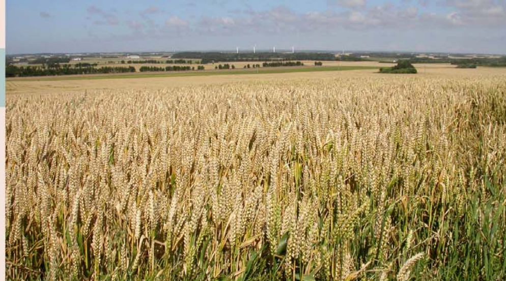
Uitgestrekte graanvelden in Noord-Jutland

► Dit symbool verwijst naar de uitneembare kaart