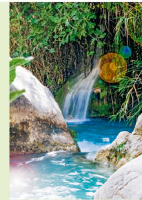
Voor jou gevormd door de rivier: natuurswembad Fonts de l'Algar.

Moors aandoende dorpen, zoals Benifato, Beniardá of Confrides 7 bij de bron van de Riu Guadalest, liggen langs de weg naar Alcoi, verscholen tussen fruitboomgaarden en heuvels. Overal getuigen dorpsfontein van de waarde van het water als levensbron. De dorpsgezichten worden gekenmerkt door kronkelende steegjes. Het dorp Penàguila 8 met zijn adellijke huizen wordt omgeven door riviertjes.