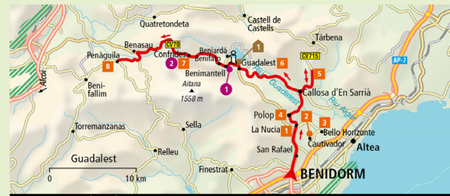
Uitneembare kaart: E/F 8

Een verblijf in het Vivood Landscape Hotel 1 biedt de perfecte combinatie van eenvoud en luxe. Het ontwerp van de architect Daniel Mayo is gebaseerd op de ecologische duurzaamheidsprincipes. De gebouwen versmelten met hun omgeving. Geniet van een spectaculair uitzicht vanuit het restaurant (Ctra. Guadalest-Alcoi, km 10, tel. 966 31 85 85, www.vivood.com, 2 pk vanaf € 170 incl. ontbijt).