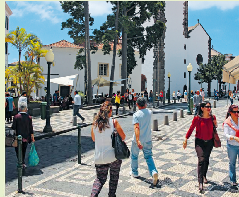
In de belangrijkste winkelstraat van Funchal paraderen de stedelingen dag in dag uit. De kathedraal vormt er het decor.

Mooi uitzicht op de kathedraal biedt het terras van Café Apolo 8 (Rua Dr. António José de Almeida, tel. 291 23 46 00). Het gebouw is een fraai voorbeeld van art deco met aan de bovenkant van de gevel een speels bloemenfries van kleurig beschilderde tegels ( azulejos ).