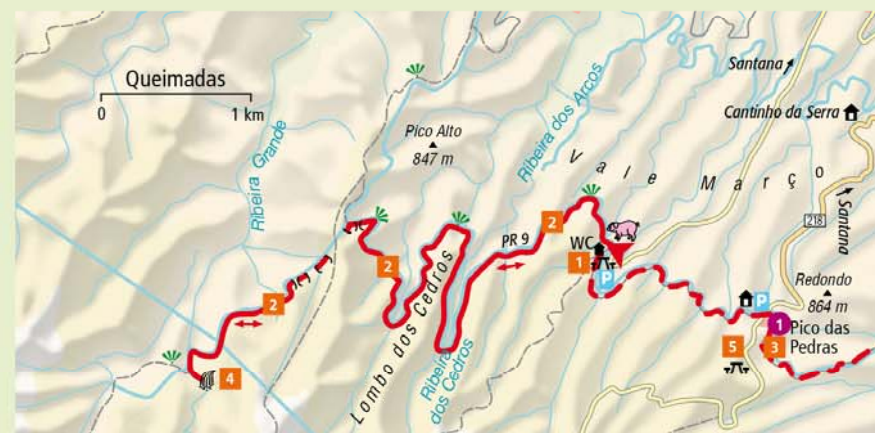
Uitneembare kaart: G 4

In het weekend kun je hier makkelijk in contact komen met eilandbewoners. Bijvoorbeeld op de picknickplaats van de boswachterij Pico das Pedras 5 . Hele families grillen dan de onvermijdelijke espitada (vleespiesjes), drinken rode landwijn en brengen de dag door met kletsen en kaartspelen.