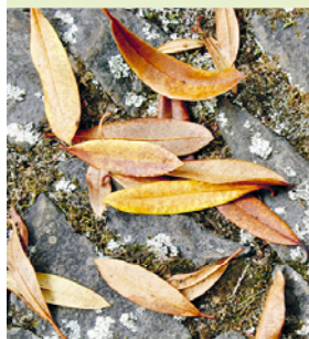
De stugge bladeren van de rododendron geven een herfstachtig tintje aan de met mos bedekte weg.

Eenden zwemmen snaterend in vijvers. Enkele met riet gedekte huizen staan tussen de rododendrons. Knoestige bomen omzomen smalle wegen, tussen het sappige groen bloeien exotische bloemen. De bostuin gaat naadloos in het laurieroerwoud over.