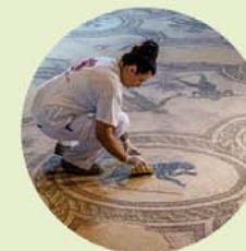
Restauratie van de mozaïeken in de Villa dei Mosaici.

Santa Maria Maggiore 4: Via Cavour, zomertijd ma.-za. 8.30-12.30, 15-19, zon- en feestdagen 9-12.30, 15-19, wintertijd ma.-za. 8.30-12.30, 15-18, zon- en feestdagen 9-12.30, 15-18 uur. Niet toegankelijk tijdens kerkdiensten.