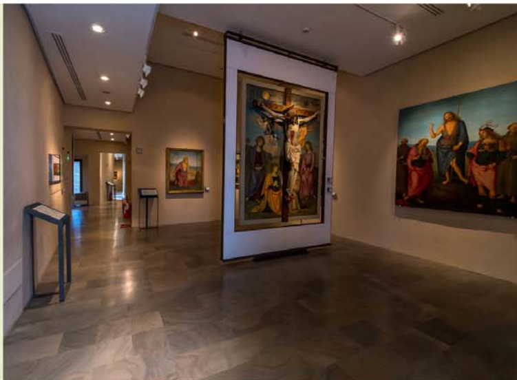
Vol schitterende kunstwerken: de Galleria Nazionale dell'Umbria.