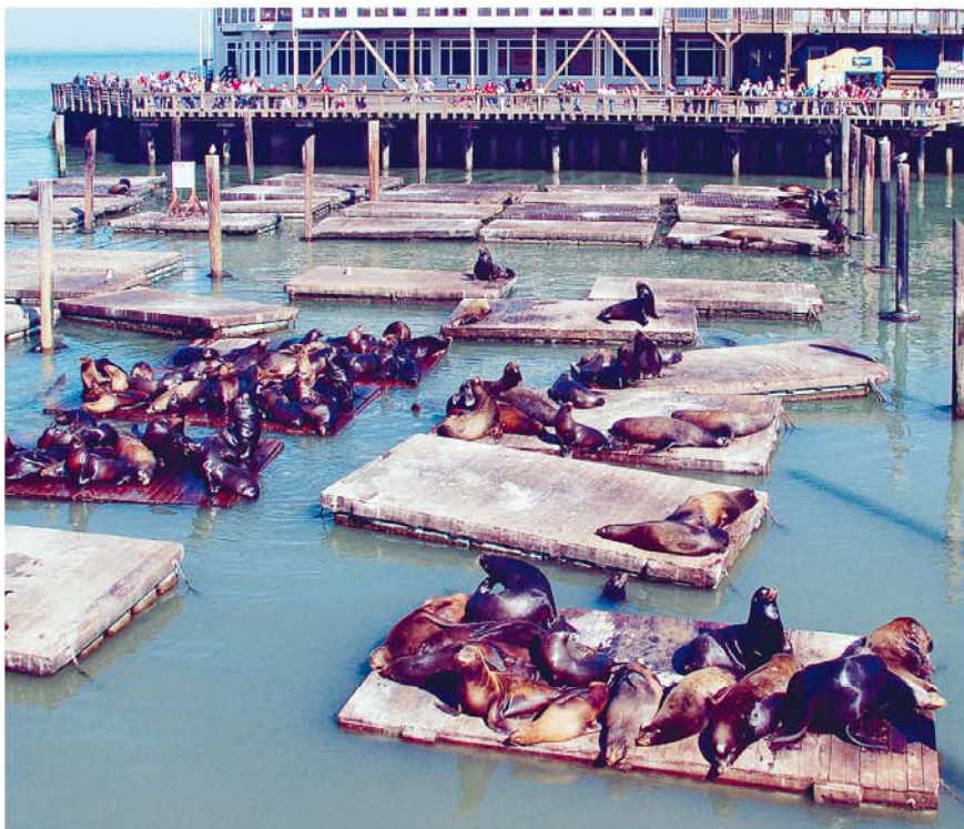
De zeeleuwenkolonie bij Pier 39 trok in 2009 even noordwaarts naar Oregon, maar is sinds 2010 weer terug

Eten in stijl – Zuni Café 12: 1658 Market St., tel. 1 415 552 25 22, www.zunicafe.com , di.-za. 11.30-23, zo. 11-23 uur. Legendarisch restaurant met voortreffelijke oesterbar en menu's (Italiaanse keuken). Hoofdgerecht $ 20-32.