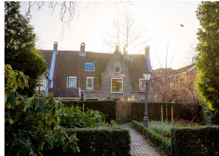
Hofje van Letmaet, Gouda.