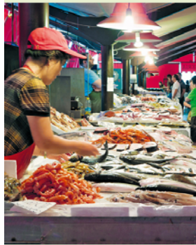
Super vers en kleurrijk: de vismarkt van Chioggia.

De visafslag van Chioggia gaat 's ochtends al om vier uur open, zodat de partijen vis tijdig van eigenaar kunnen wisselen. De potentiële kopers fluisteren daarbij de veilingmeester ('astatore') hun bod in het oor. Als de vroege kopers vervolgens vanaf acht uur op de vismarkt zelf verkoper worden, gaat het er verder luidruchtig en vrolijk aan toe.