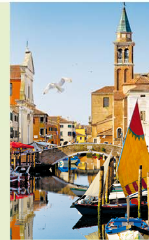
Langs het Canal Vena in Chioggia lijkt het wel alsof La Serenissima een kleine satelliet heeft afgeworpen.