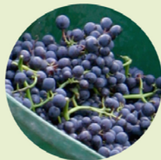
Verse oogst Spätburgunder.

Ga op pad tussen de wijnstokken, geniet in het voorjaar van het ontluikende groen, in het najaar zie je de bedrijvigheid op zijn top – de hele familie helpt mee – en tot besluit stralen de hellingen in hun herfststooi. Net als de druiven profiteer je als wandelaar op de zuidhellingen optimaal van de zon. De Rotweinwanderweg is uitstekend gemarkeerd.