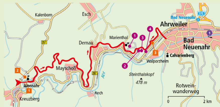
Uitneembare kaart: E 4 | Ahrtalbahn

Ahr-Therme 1: Felix-Rütten-Straße 3, 9-22, vr.-za. tot 23 uur, baden 2 uur € 11, dagpas € 17, sauna + € 7.