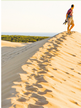
Pilat is een stuifduin waar je heerlijk blootsvoets kunt wandelen.

Met een hoogte van 108 m en een breedte van 500 m zijn de duinen van Pilat de grootste van Europa. Geen wonder dat het zandgebergte na Mont St-Michel in Normandië het drukstbezochte natuurwonder van Frankrijk is. Maar wie 's ochtends vroeg komt, heeft de Sahara aan de Atlantische Oceaan vrijwel voor zich alleen.