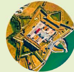
Omgekeerde wereld: vanuit de lucht zie je de stervorm van de vesting het best.

Via de met schietgaten en wachttorens omzoomde weergang kom je bij de haveningang 5 – ook deze werd uiteraard beschermd door verdedigingswerken. Iets verderop vind je het Musée Ernest-Cognacq 6. Een zaal van dit eilandmuseum is gewijd aan Vauban. Het belangrijkste object is een maquette van St-Martin-de-Ré, die je ook gewoon mag aanraken. De maquette omvat alle locaties die je net hebt bezichtigd.