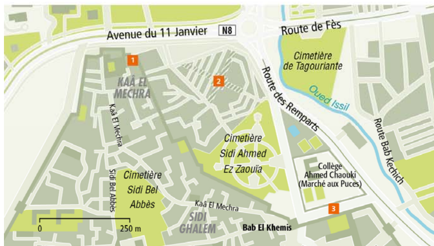
Uitneembare kaart: E/F 3 | wijk: medina, noordsector