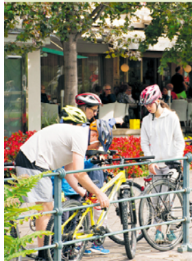
Startklaar voor het Passeiertal?

Uitneembare kaart: E 3-4 | Plattegrond: blz. 87 | Fietsverhuur: ► blz. 92 | Fietstocht: licht (stadsfiets/citybike is voldoende), heen/terug ca. 4 uur