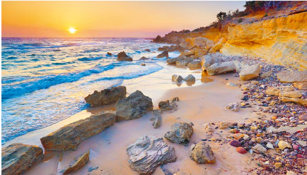
De kust bij Limiónas is niet de mooiste van het eiland – hij is eerder een extraatje bij je vooral voor de enige, 's zomers vaak drukke taverna. Op het menu staan natuur-

zee ligt. Het eten is in orde en de sfeer meer dan goed. De gasten van het restaurant mogen de ligstoelen op het kiezelstrand gratis gebruiken.