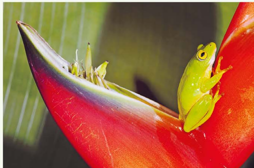
In het iSimangaliso Wetland Park

Goed om te weten: in Durban is de kans om overvallen te worden, vooral na het invallen van de duisternis, groot. Ga 's avonds nooit en overdag alleen in drukke buurten lopend op pad. Langs de zeepromenade houden geüniformeerde bewakers meestal een oogje in het zeil. Toegang: hoewel er al jaren plannen zijn voor een snelweg langs de kust leiden tot nu toe alleen enkele doodlopende wegen vanaf de N 2 naar de mooie stranden van de Wild Coast. Tip: een wandeling over de Wild Coast Hiking Trail.