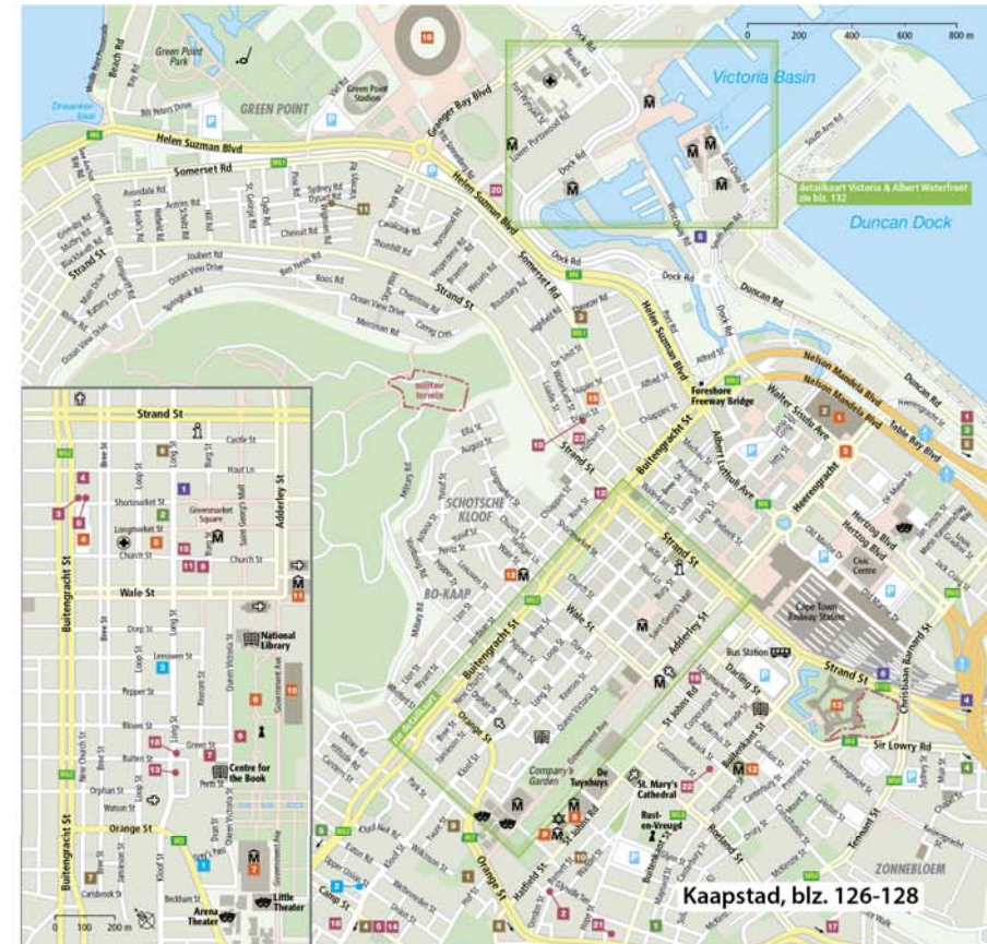
Kaapstad, blz. 126-128