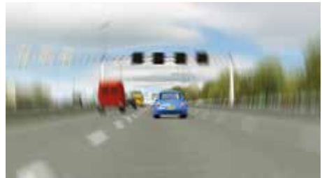
Bij gebruik van alcohol kan dit zogenaamde tunneffect ontstaan.