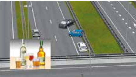
Geneesmiddelen en drugs kunnen je rijvaardigheid beïnvloeden.

Het rijden onder invloed is een misdrijf. Het is iedereen verboden een voertuig te besturen, of als bestuurder te doen besturen (rij-instructeur of rij-examinator), terwijl hij verkeert onder zodanige invloed van een stof, waarvan hij weet of redelijkerwijs moet weten, dat het gebruik daarvan, al dan niet in combinatie met het gebruik van een andere stof, de rijvaardigheid kan verminderen, dat hij niet tot behoorlijk besturen in staat moet worden geacht. Deze stoffen zijn alcohol, bepaalde geneesmiddelen en drugs. Het negatief effect van geneesmiddelen en/of drugs wordt versterkt in combinatie met alcoholgebruik.