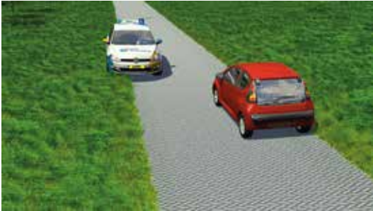
Voornamelijk op smalle wegen zullen beide bestuurders moeten uitwijken.

Bij het tegenkomen van andere weggebruikers moet jij en het tegemoetkomende verkeer -indien nodig- zover naar rechts uitwijken dat er voldoende zijdelingse afstand blijft.