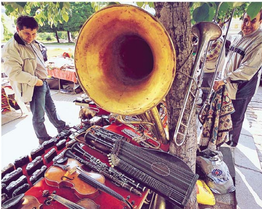
Op een pleintje voor de Alexander-Nevski-kathedraal staat elke dag een vlooienmarkt

producten, alles is zelfgemaakt en smaakt verrukkelijk. Broodjes vanaf BGN 5.