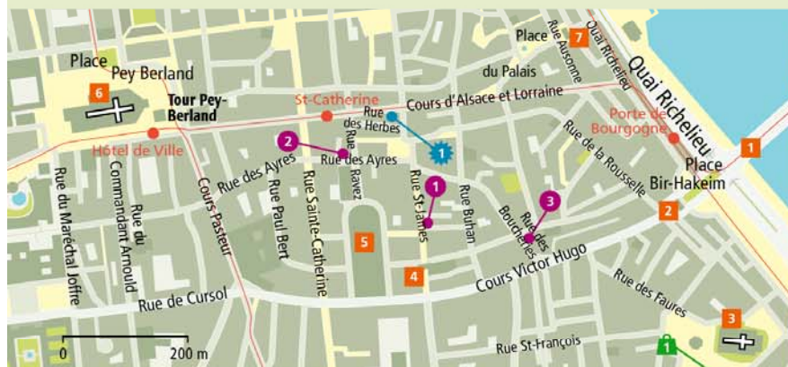
Uitneembare kaart kaart 2, A-F 4-6 | Tram A en C: Porte de Bourgogne, A/B: Hôtel de Ville

Tussen kunst en vintage laveert de bar La Vie Moderne 4 (72, cours Alsace Lorraine, dag. 18 (zo. 21)-2 uur). Je drinkt hier lekkere cocktails terwijl je luistert naar muziek uit de jaren 60 tot en met 80.