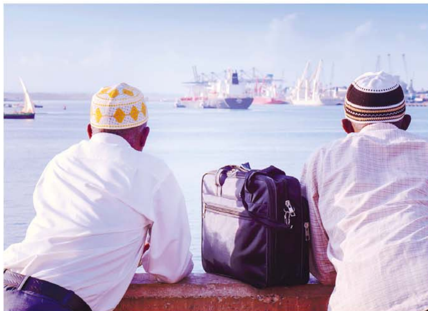
De haven – de reden waarom Dar es Salaam uitgroeide tot een metropool

met knalrode stoelen en zonweringen, waar gerechten uit de landen rond de Middellandse Zee worden geserveerd. In het weekend wine bar (goede sortering) met livemuziek. Vanaf TSh 30.000.