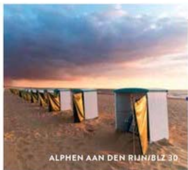
ALPHEN AAN DEN RIJN/BLZ 30