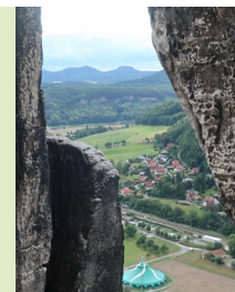
Uitzicht vanaf de Bastei.

Als je vooral op zoek bent naar een restaurant of slaapplek, kun je naar het gezellige, van terrassen langs de Elbe voorziene Stadt Wehlen 6 , waar ook de stoomboot van de Sächsische Dampfschiffahrt aanlegt. Of je kiest voor kuuroord Bad Schandau 7 , hét (drukke) centrum van de streek waar zich het bezoekerscentrum van de Sächsische Schweiz bevindt. Hiervandaan kun je een mooie tramrit maken door het Kirnitzschtal tot de waterval van Lichtenhain.