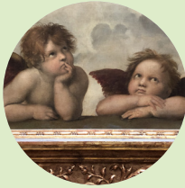
De bekende engeltjes van Rafaëls Sixtijnse Madonna sieren tal van souvenirs.

Tegenover de Kronentur bevindt zich de Gemäldegalerie Alte Meister und Skulpturensammlung bis 1800 8 , een walhalla voor kunstliefhebbers. Dit neoklassieke gebouw werd midden 19e eeuw aan het Zwingercomplex toegevoegd door Gottfried Semper, de architect die ook de naar hem vernoemde Semperoper tekende. Hier kun je