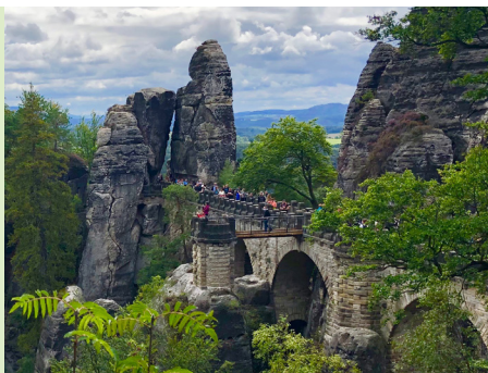
De zandstenen brug bij de Bastei.