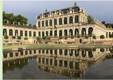
In de Zwinger bevinden zich verschillende musea.

eindeloos genieten van een omvangrijke verzameling Europese schilderkunst uit de 15e tot 18e eeuw én beeldhouwkunst van antiek tot renaissance. Traditioneel worden de Ganymedes van Rembrandt en de Sixtijnse Madonna van Rafaël tot de absolute highlights gerekend. Andere grote namen zijn Vermeer, Rubens, Hals, Jordaens, Correggio, Titiaan, Tintoretto en Guercino. Bovendien beschikt het museum over de grootste collectie ter wereld van Lucas Cranach de Oude en de Jongere.