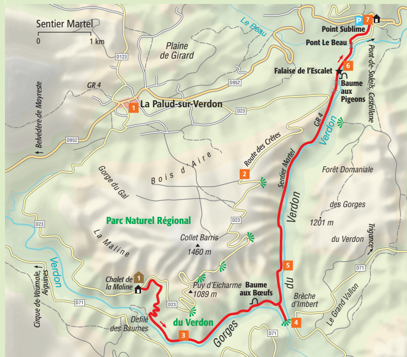
Uitneembare kaart: L 5

In het voorjaar is de Gorges de Verdon een lust voor het oog. Bijna driekwart van alle orchideeën die in Europa voorkomen, gedijt in deze kloof.