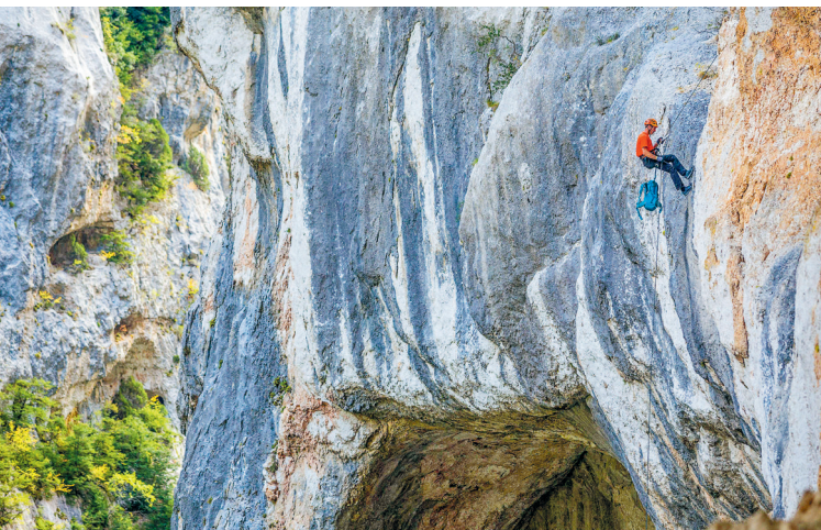
Anrader voor wie geen hoogtevrees heeft! De Gorges du Verdon heeft de meest dramatische afgronden van de Provence. Niet alleen klimmers zijn er verrukt van!

kiezelstrandje uit om je voeten af te koelen in de ijskoude Verdon.