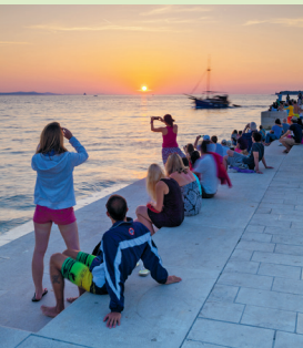
Een fluisterende zee en een zonsondergang bij het zee-orgel.