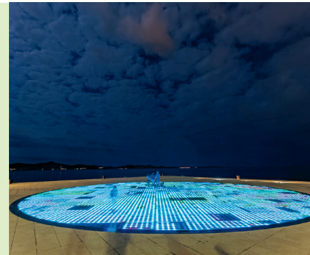
Bašić's 'blauwe zon' straalt vanaf de blauwe planeet naar de nachtelijke hemel en zendt een groet aan zijn hemelse tegenhanger die is ondergegaan.