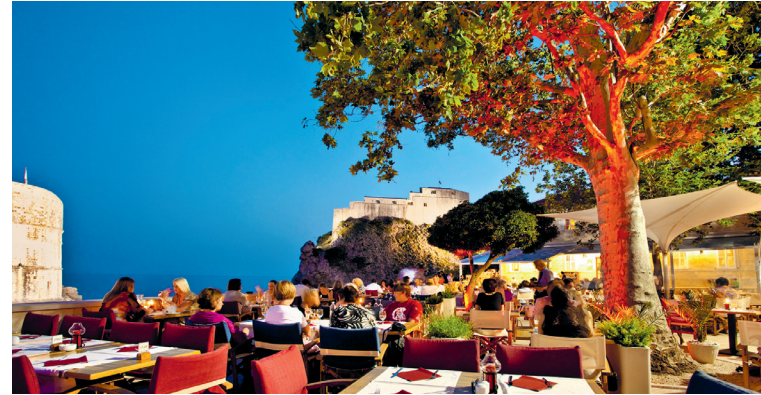
De dag de revue laten passeren, je blik over zee en over de stadsmuur van het oude Ragusa laten glijden – in Dubrovnik vind je daarvoor altijd wel een plekje.

Veerboten: www.jadrolinija.hr. Tussen de stad Korčula en Orebić (schiereiland Pelješac) vaart in het hoogseizoen elk uur een veerboot.