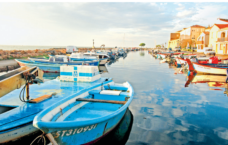
In de kleine haven van Mèze meren hengelaars en enkele beroepsvissers van het Étang hun bootjes af. Afhankelijk van het jaargetijde vissen ze op paling (anguille), dorade, zeewolf (loup), harder (muge) en gestreepte bokvis (saupe).

Agde (25.000 inw.) kent vele facetten. Landinwaarts aan de Hérault verdringen de huizen in het historische centrum zich rond de zwarte muren van de robuuste kathedraal. Bij de Cap domineren grote hotels rond de jachthaven het beeld. Bedaagder zijn de vissershaven en het badplaatsje Le Grau d'Agde en het kleine plaatsje La Tamarissière links en rechts van de monding van de Hérault.